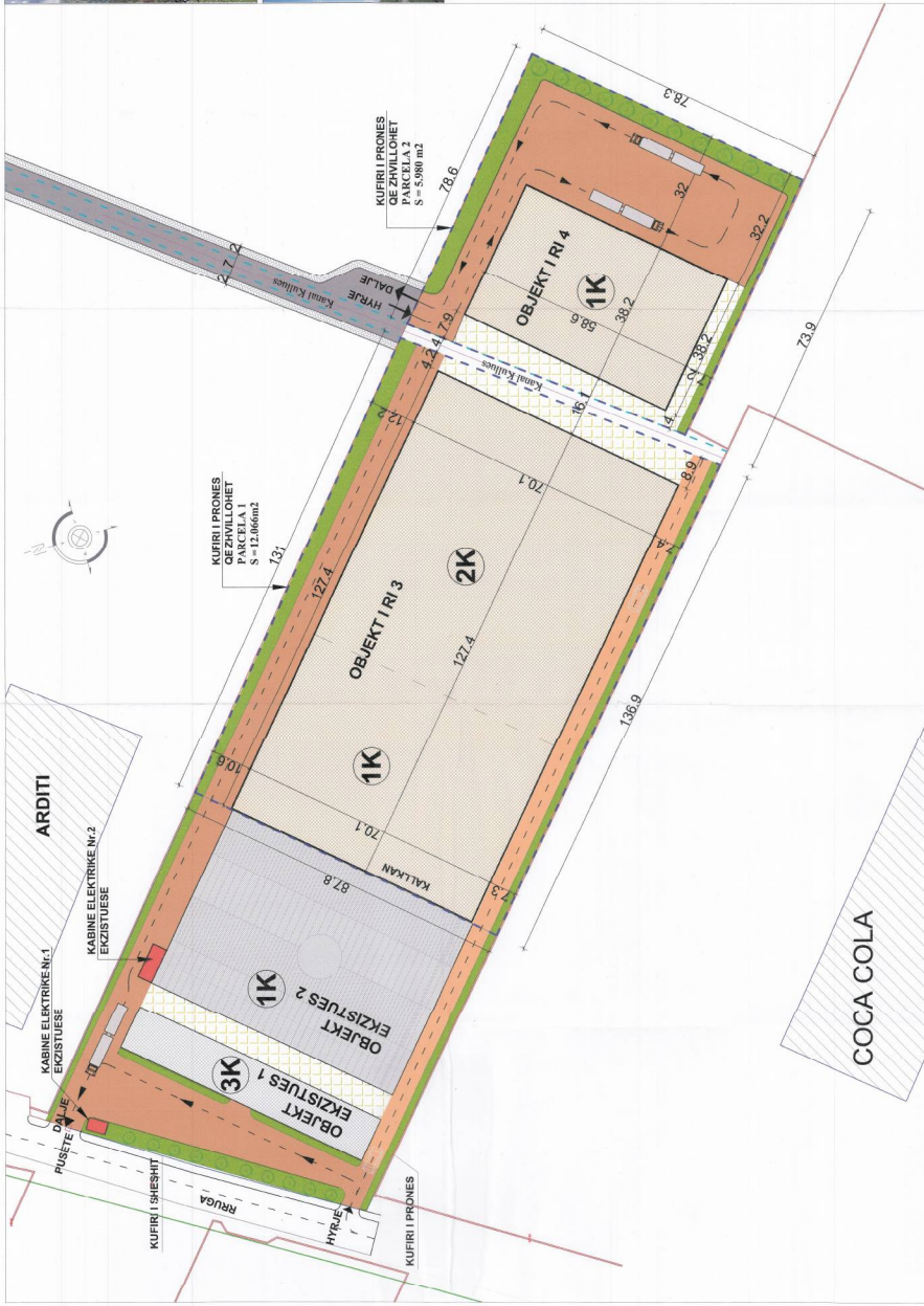
PLANI I VENDOSJES SË STRUKTURËS SHK. 1:500