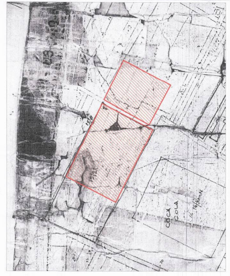
POZICIONI KADASTRAL SHK. 1:2000