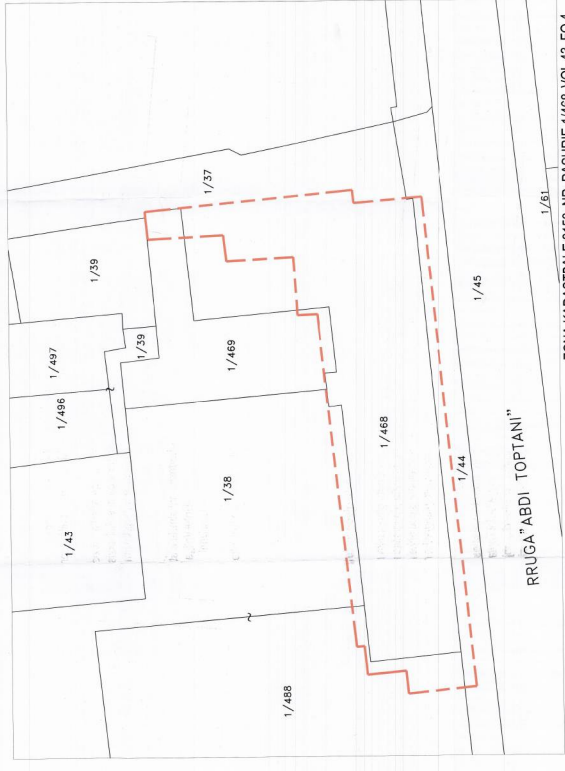
POZICIONI KADASTRAL SHK. 1:200

ZONA KADASTRALE 8150, NR. PASURIE 1/468, VOL. 43, FQ. 4