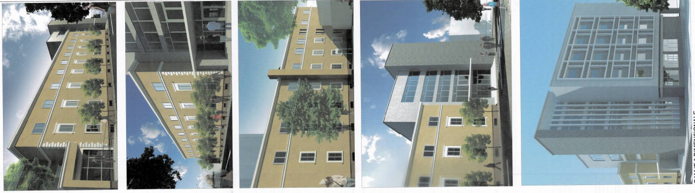
PANORAMË 3 DIMENSIONALE