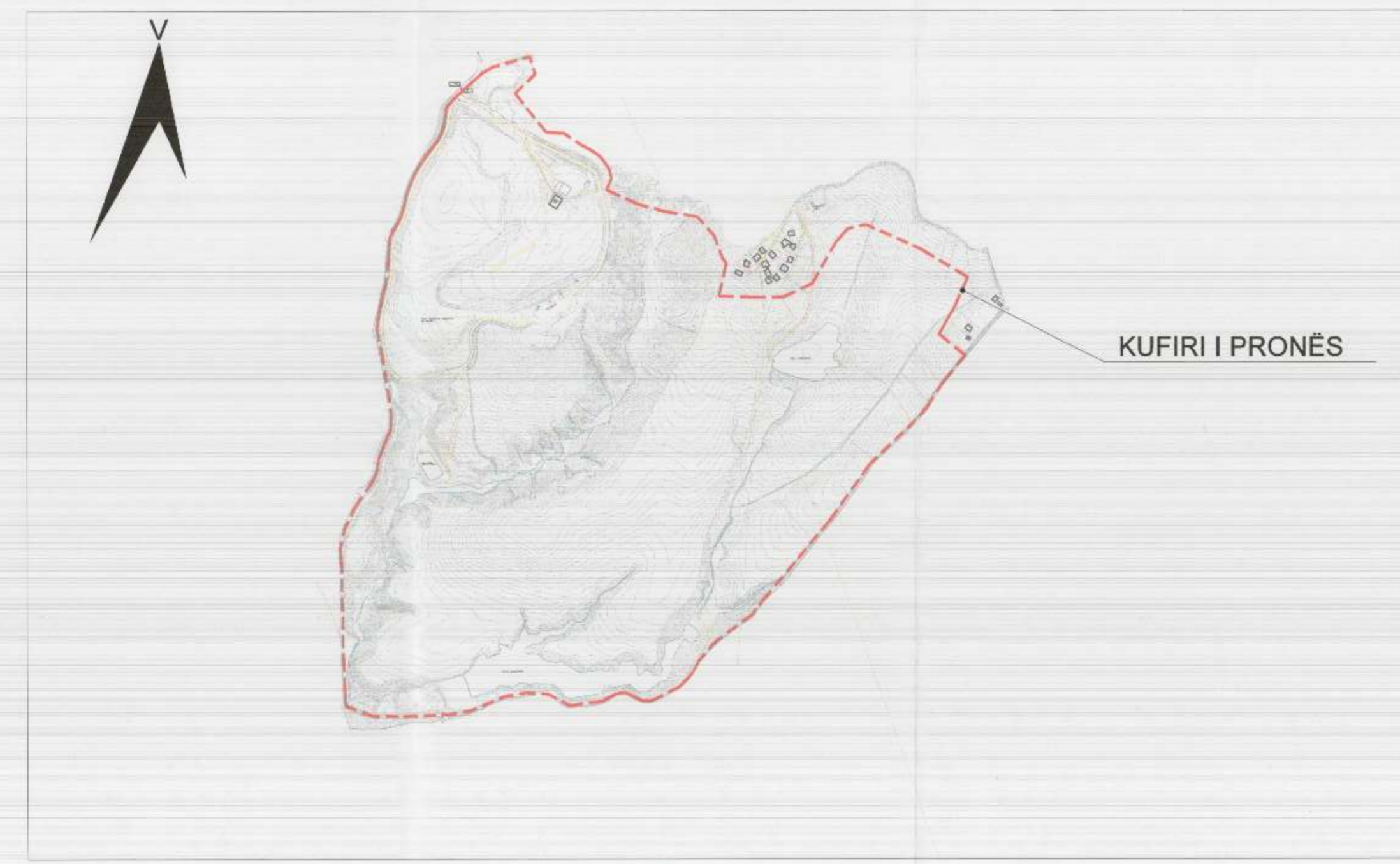
HARTA TOPOGRAFIKE SHK. 1:10000