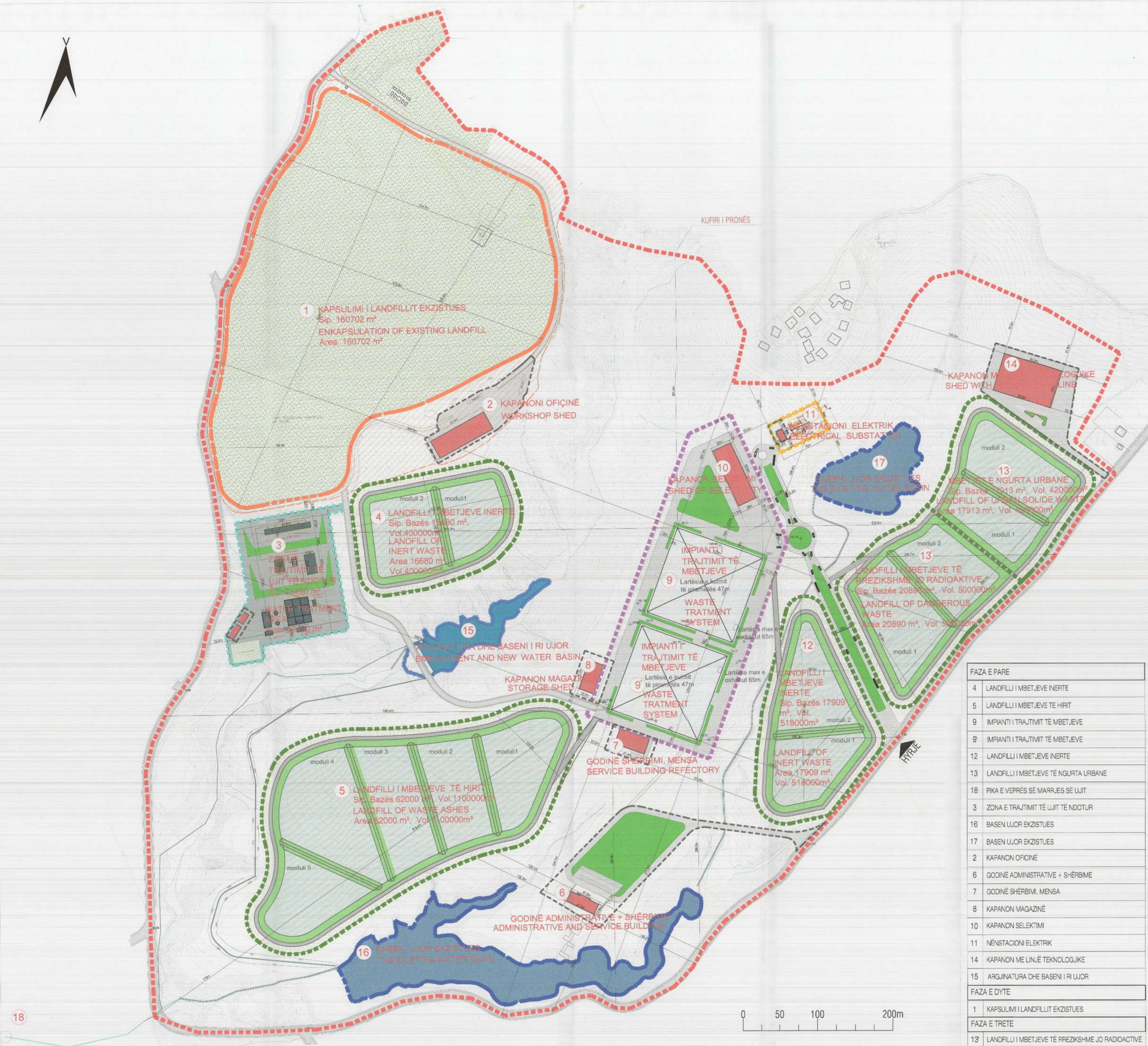
PLANI I VENDOSJES SË STRUKTURËS SHK. 1: 2500

Znj. Belinda Balluku Ministër i Infrastrukturës dhe Energjisë