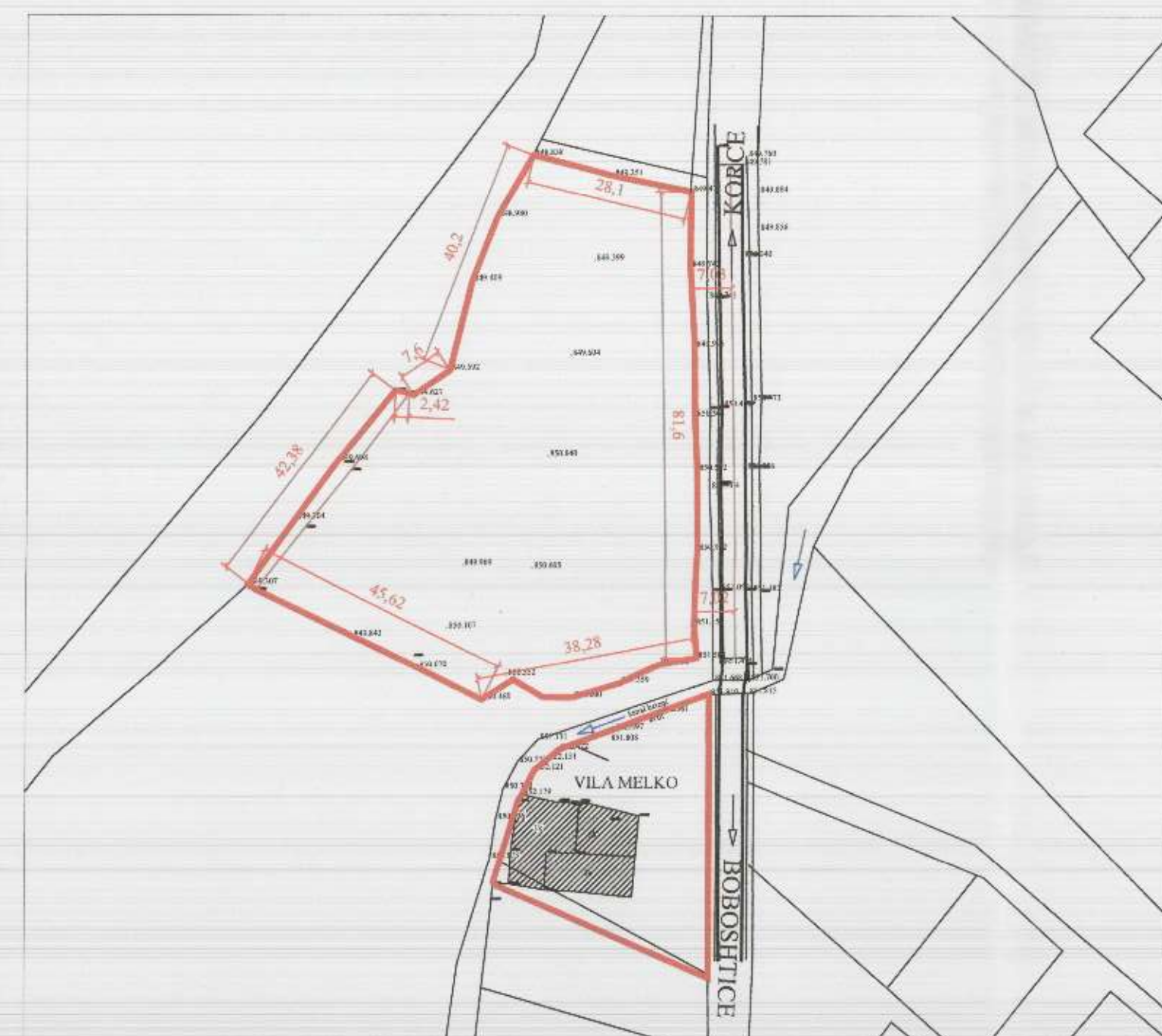
HARTA TOPOGRAFIKE SHK. 1:1000

Sipërfaqe e përgjithshme e pronës: 5,942.4 m 2 Sipërfaqe e pronës me ndërtimin ekzistues: 1228.4 m 2 (pasuria Nr. 146/6) Sipërfaqe e pronës e zënë nga struktura ekzistuese (gjurma): 372.4 m 2