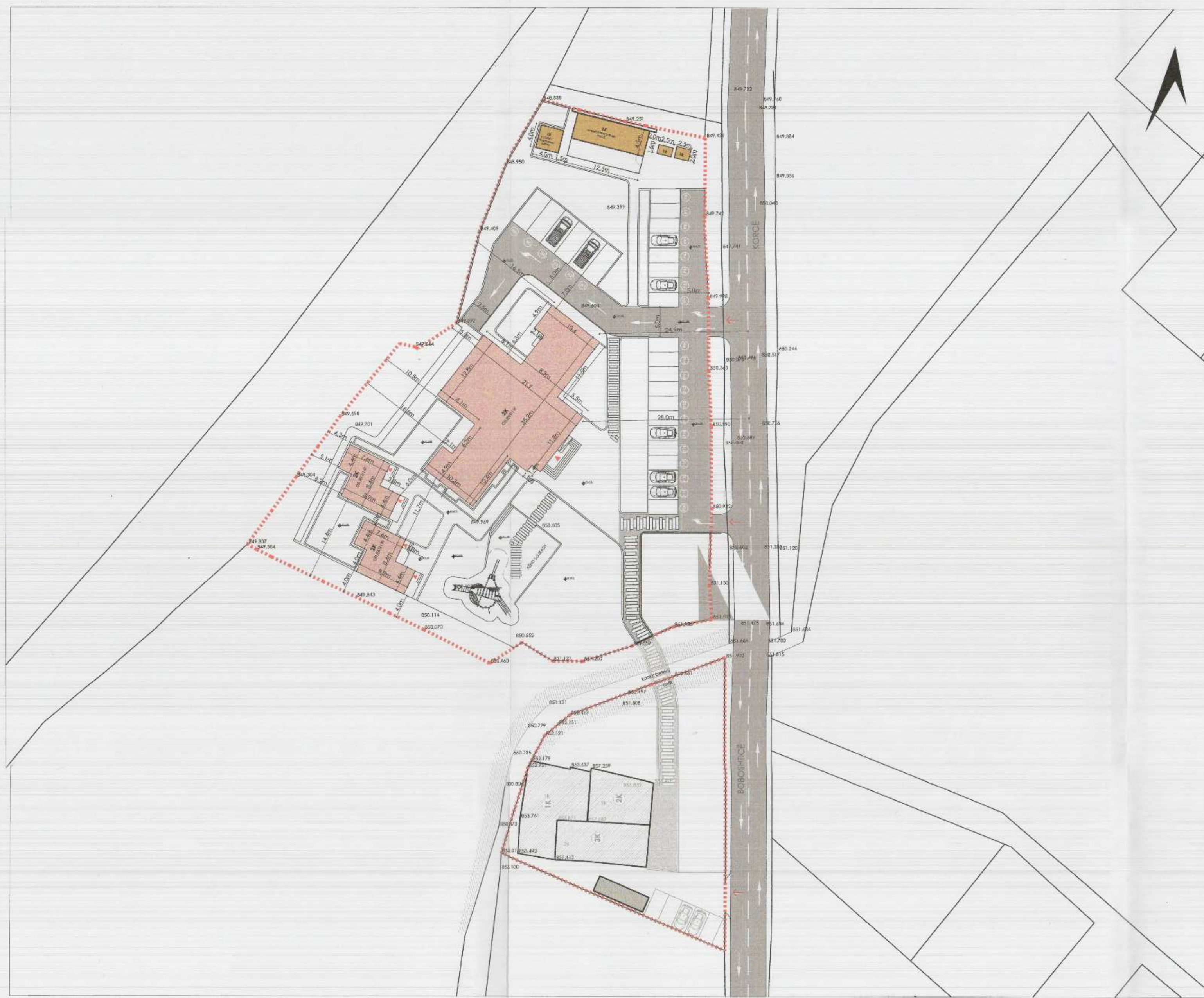
PLANI I VENDOSJES SË STRUKTURËS SHK. 1:500