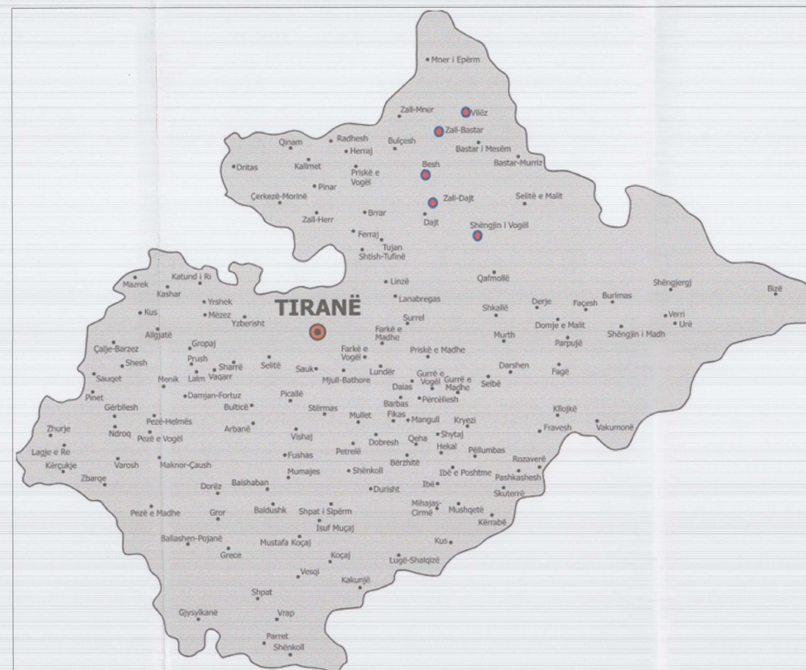
3-BASHKIA TIRANË, VEND-NDODHJA E PROJEKTTIT.