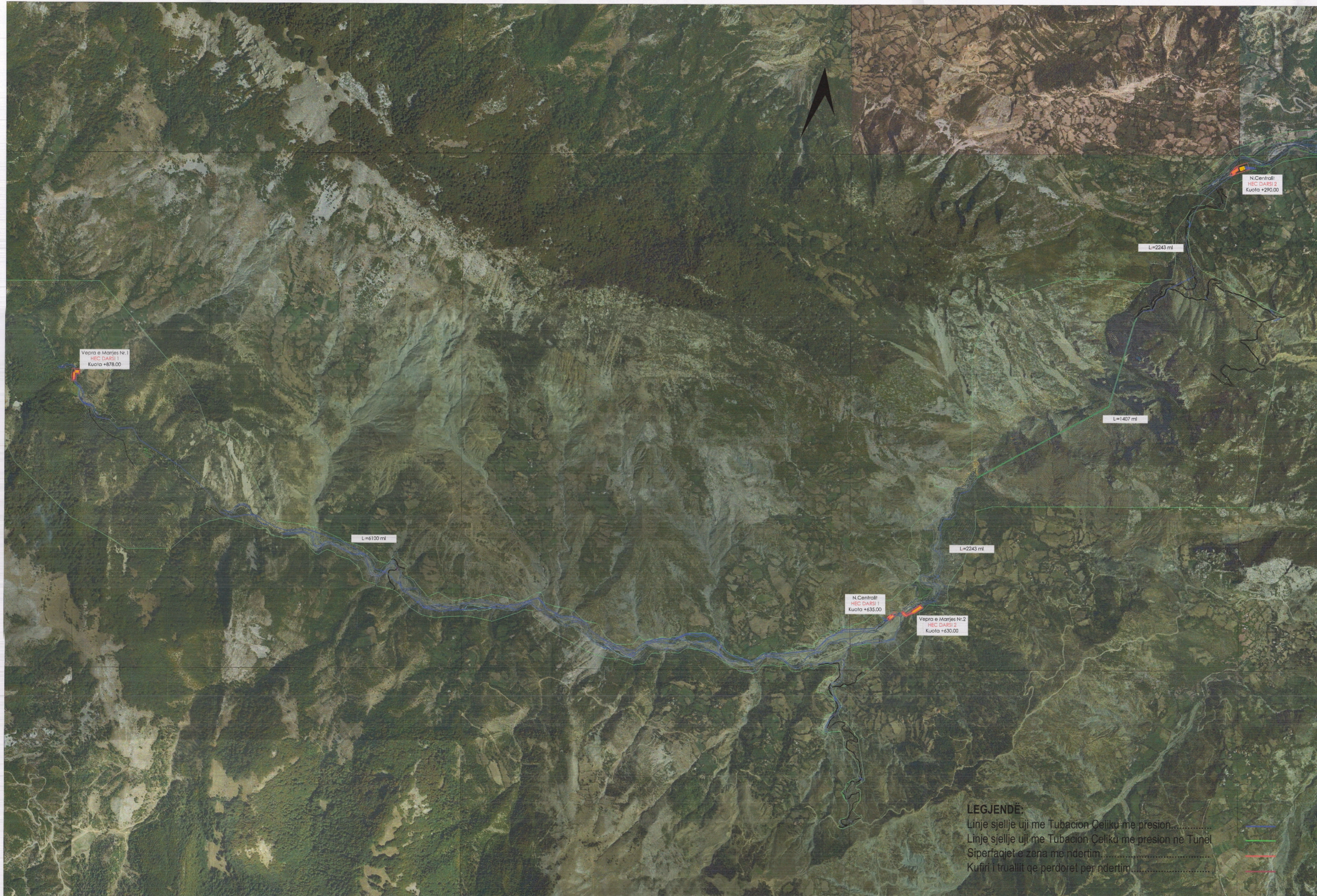
PLANI I VENDOSJES SË STRUKTURËS SHK. 1:10000