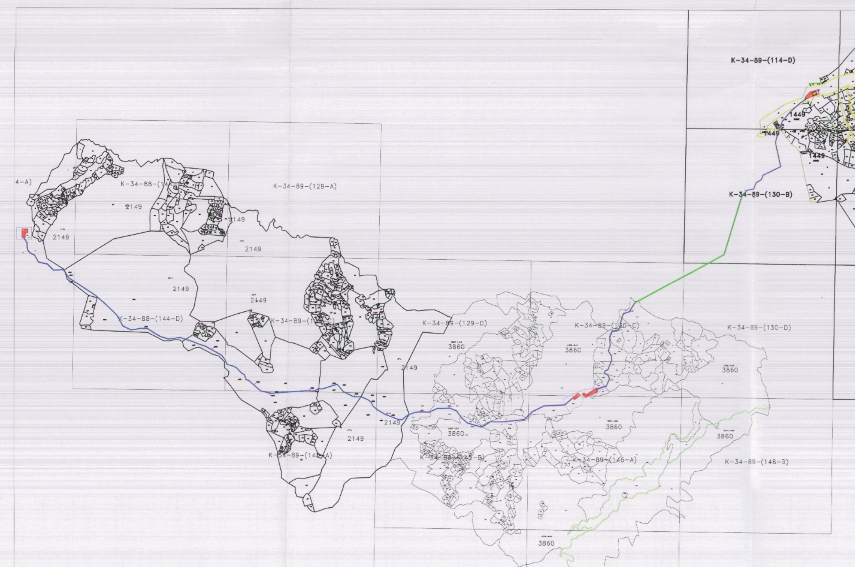
POZICIONI KADASTRAL SHK. 1:20000