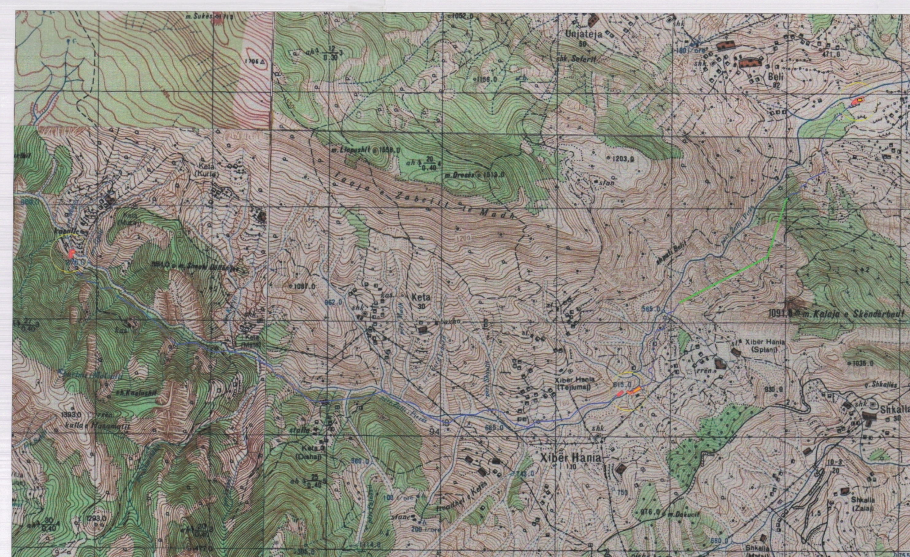
HARTA TOPOGRAFIKE SHK. 1:20000