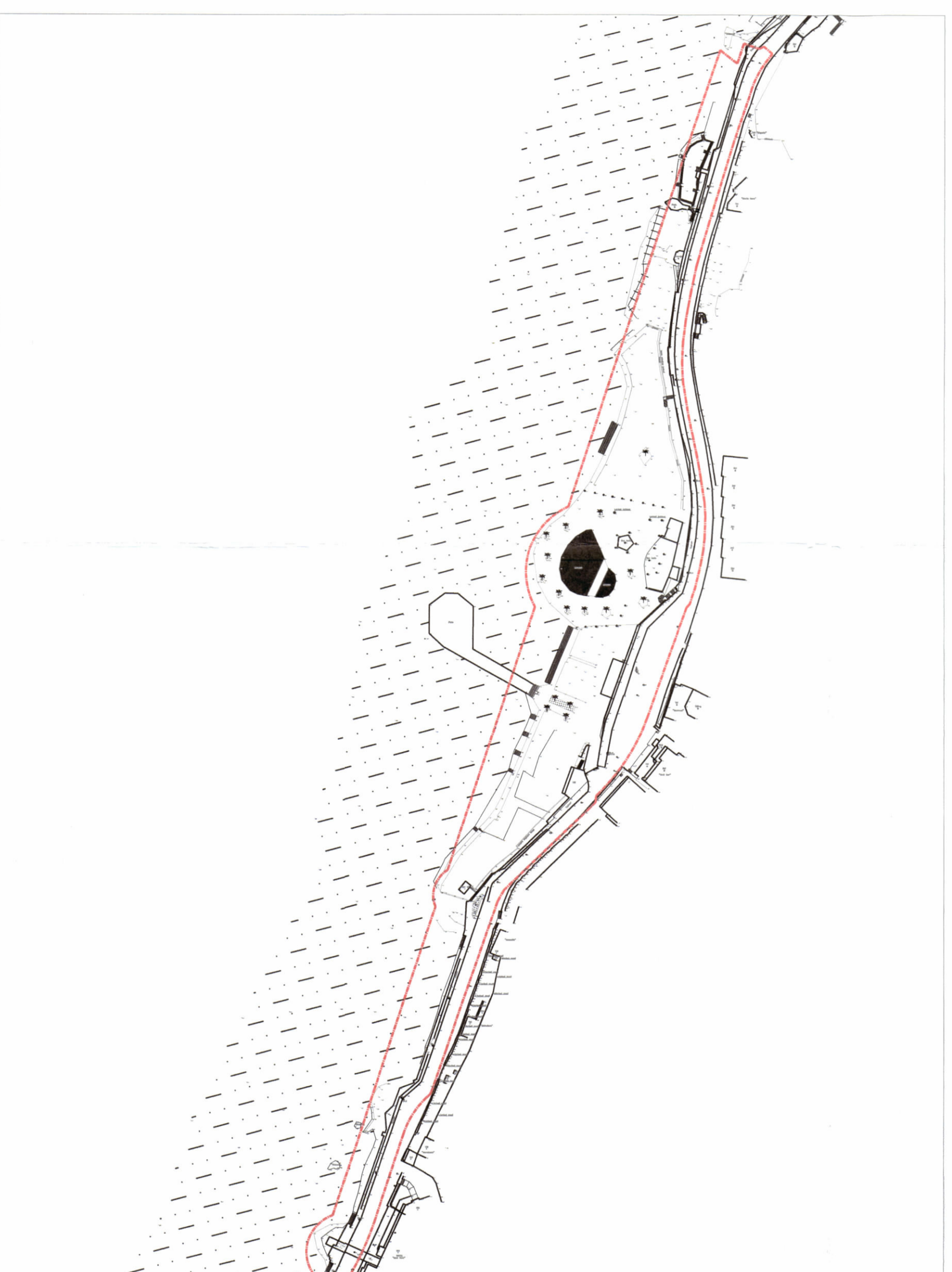
HARTA TOPOGRAFIKE SHK. 1:20000