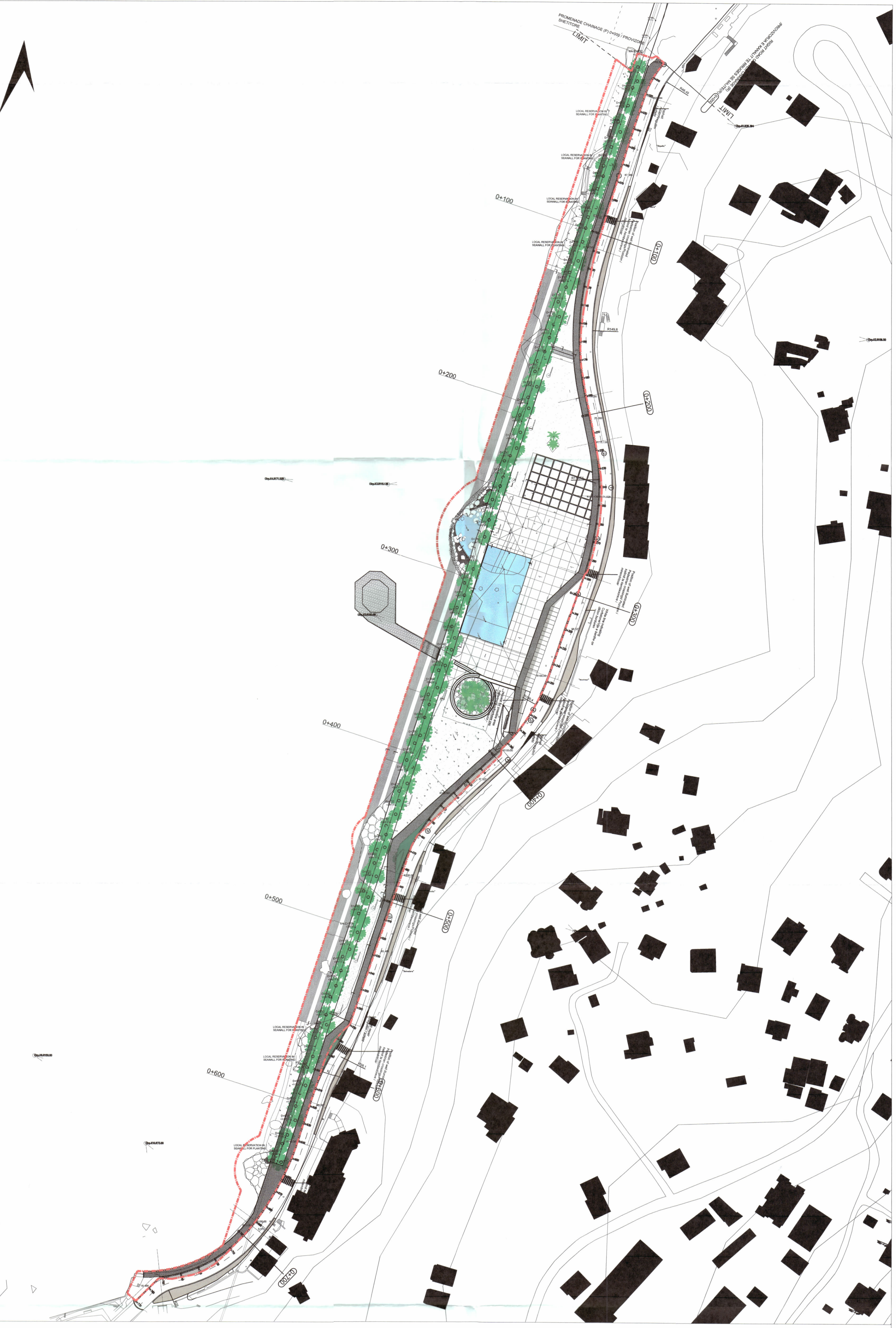
PLANI I VENDOSJES SË STRUKTURËS SHK. 1: 1000