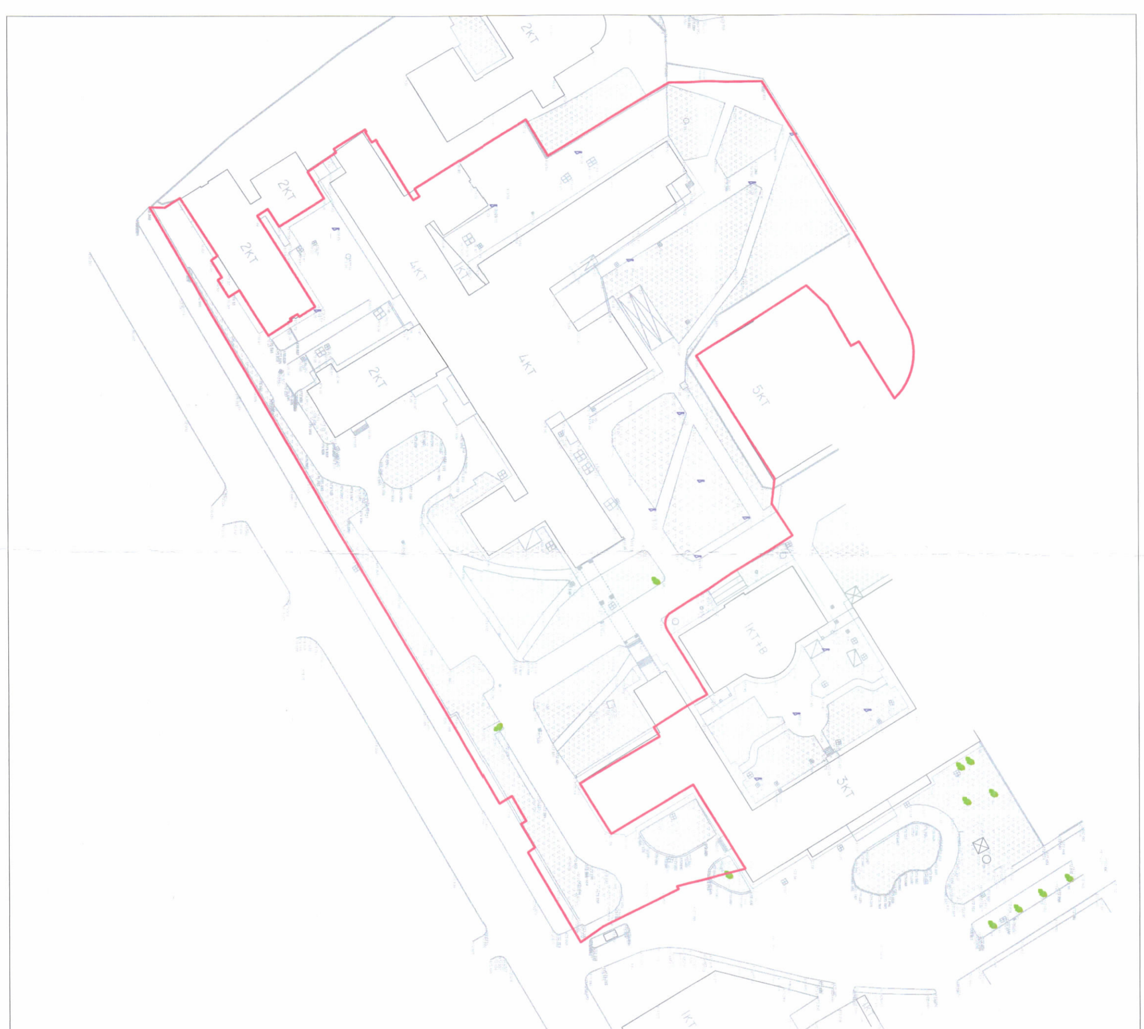
PLANI I VENDOSIES SË STRUKTURËS SHK. 1: 500