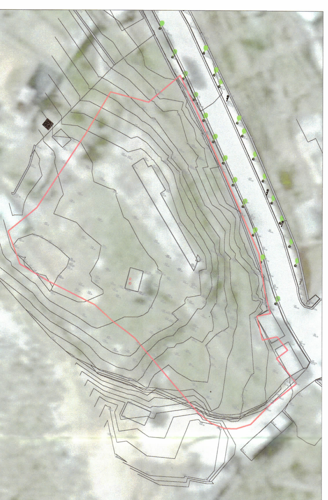
HARTA TOPOGRAFIKE SHK. 1:1500