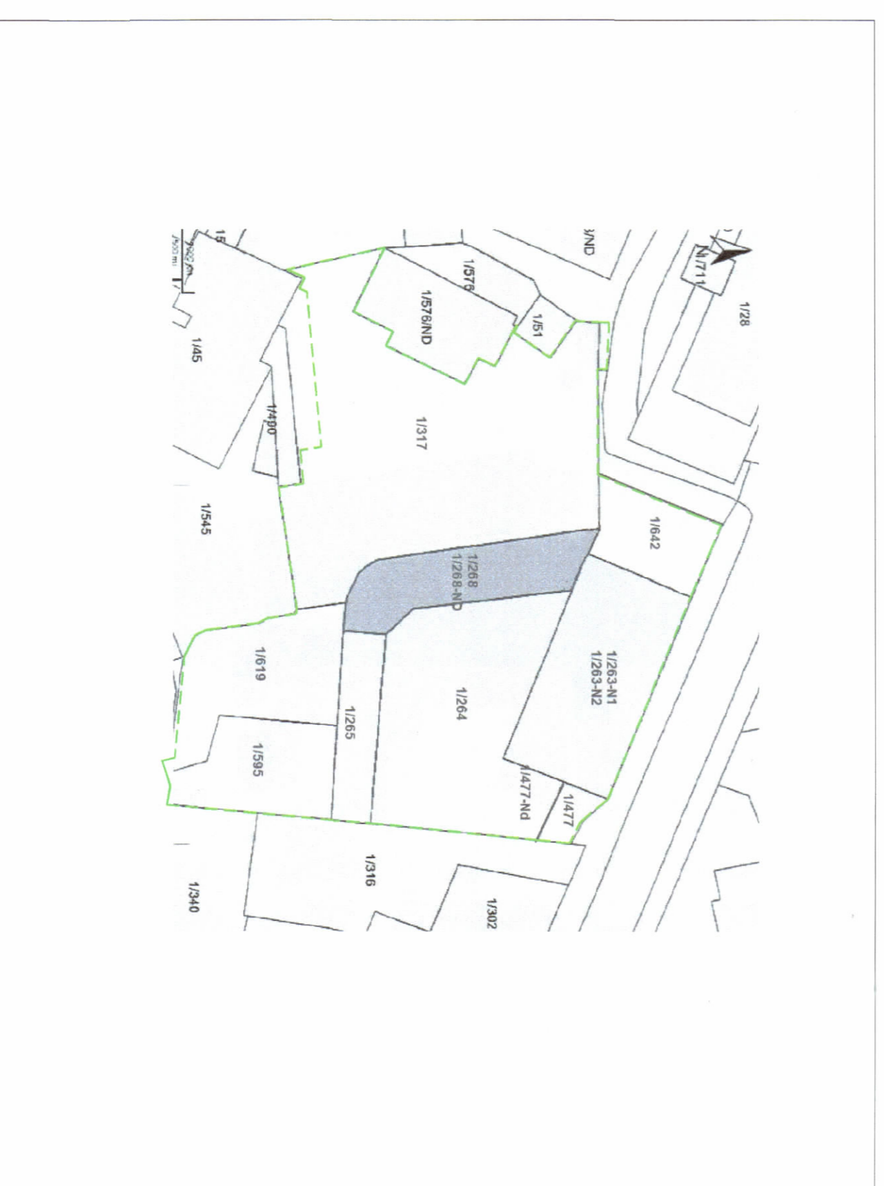
POZICIONI KADASTRAL SHK. 1: 500