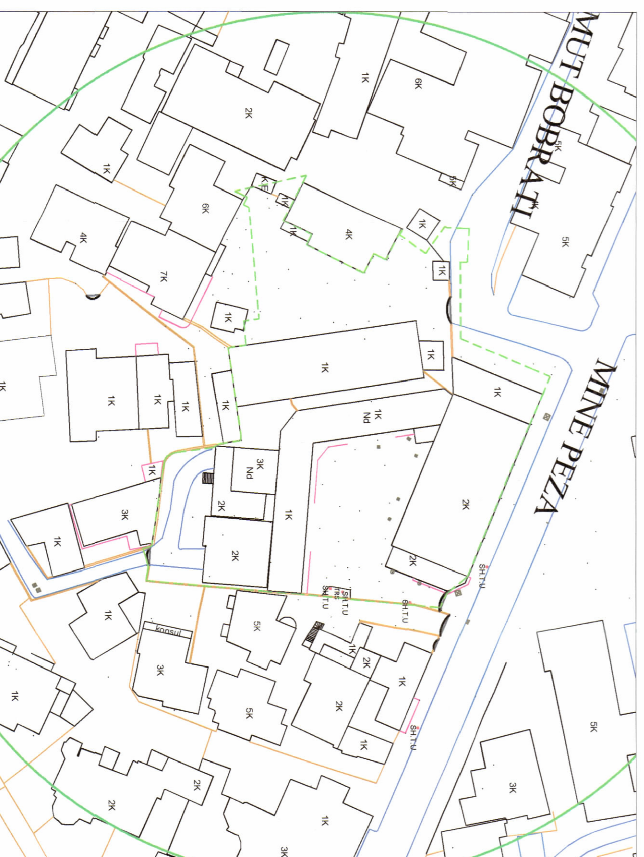
HARTA TOPOGRAFIKE SHK. 1: 500