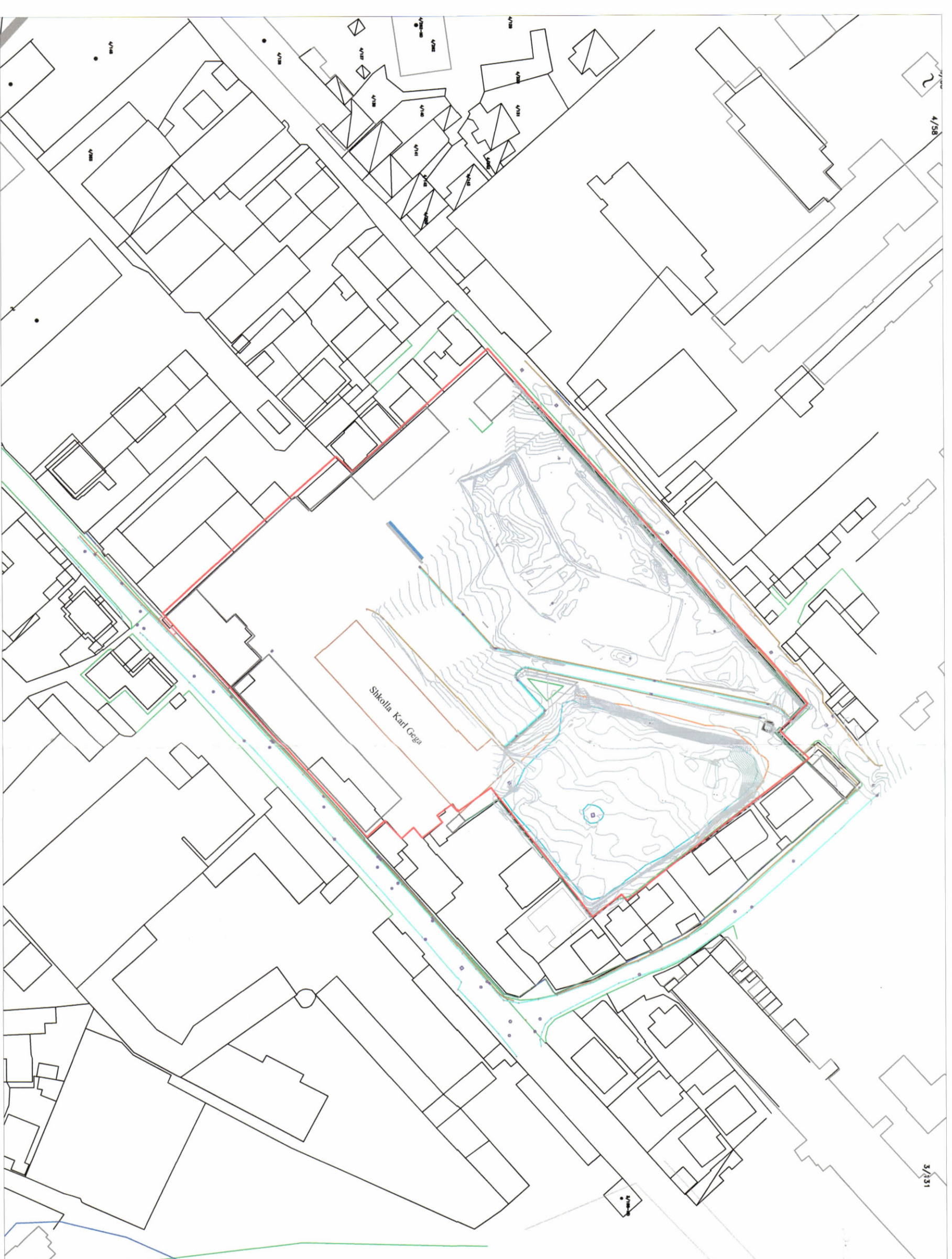
HARTA TOPOGRAFIKE SHK.1:3000