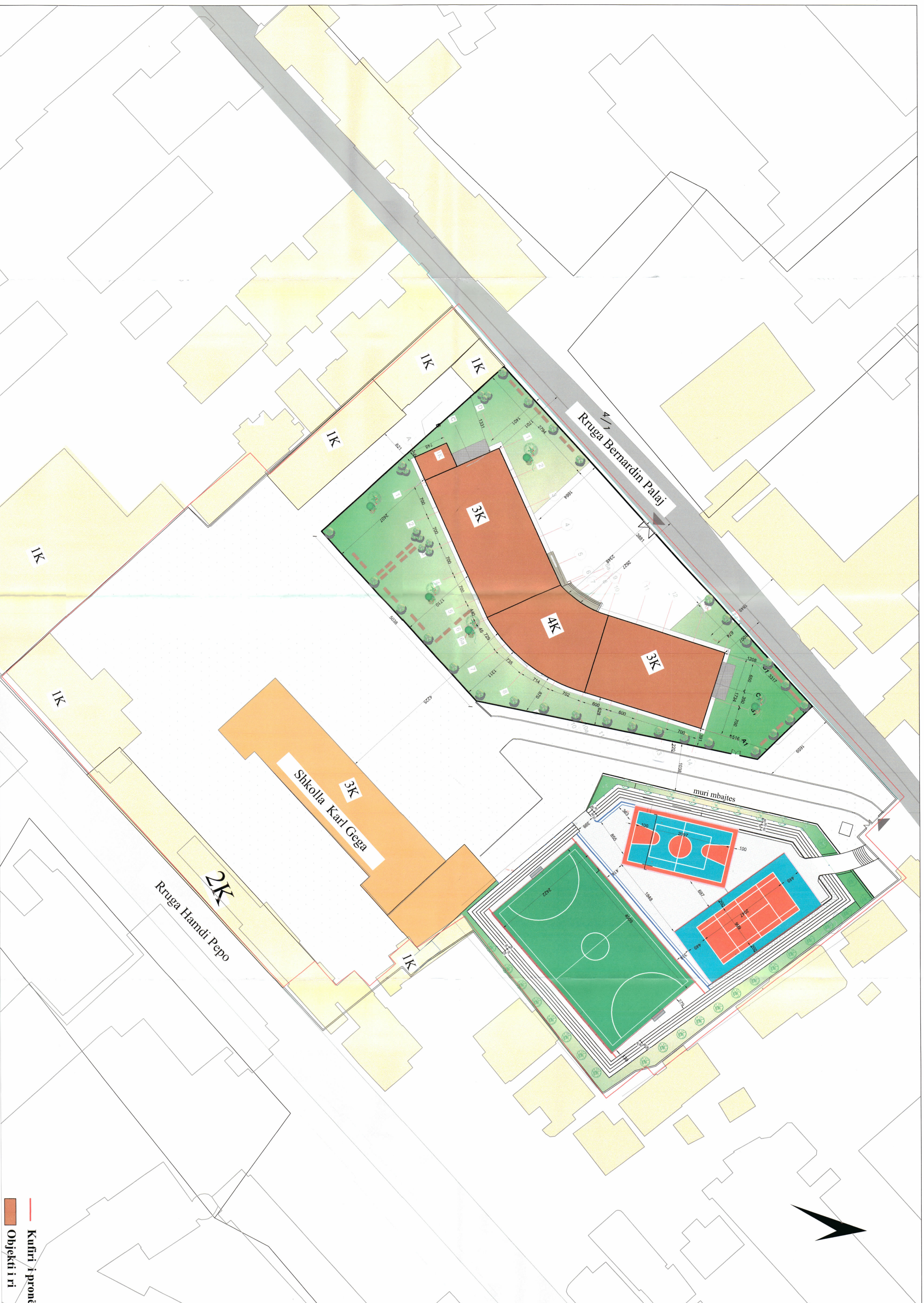
PLANI I VENDOSJES SË OBJEKTIT SHK.1:1000