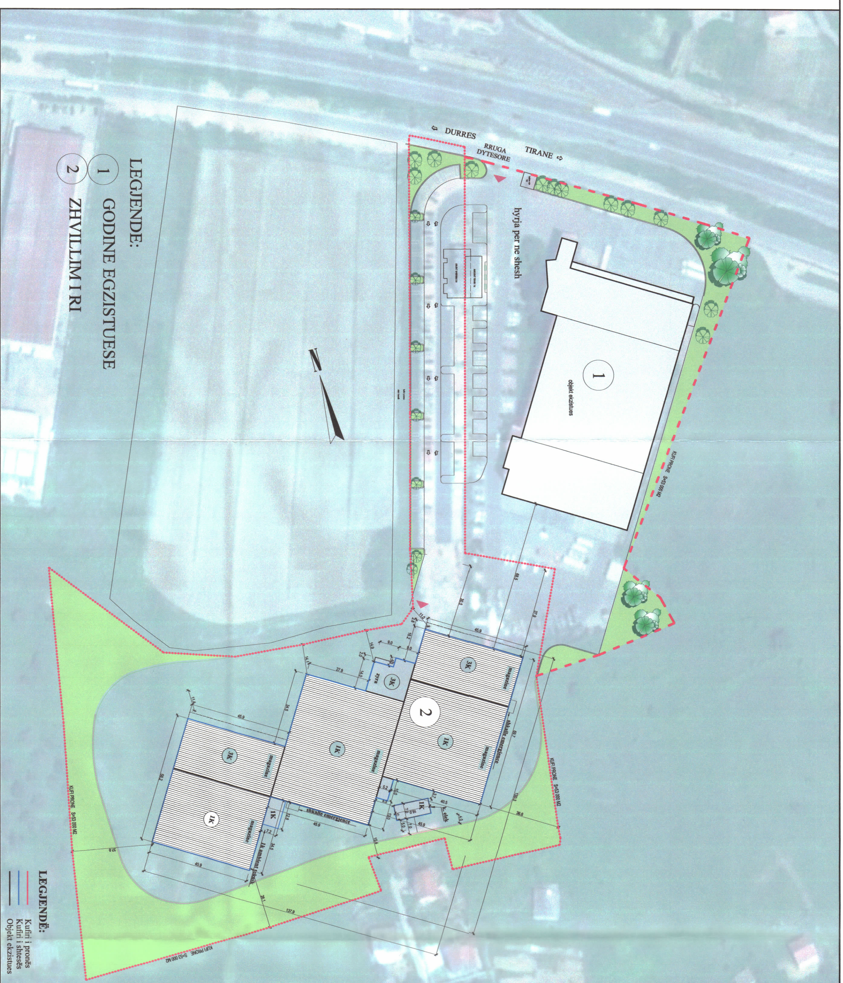
PLANI I VENDOSJES SË STRUKTURËS SHK. 1: 750

SHKALLA NR. I FLETËS NR. I KOPËVE 1:..... A-01 0106-06/06