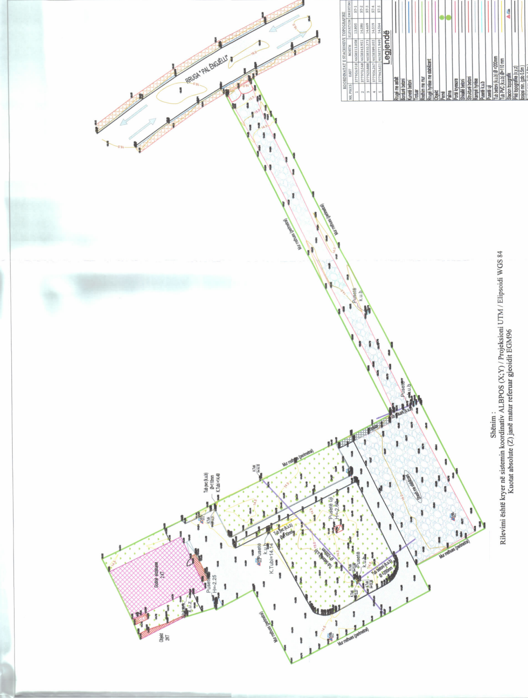
HARTA TOPOGRAFIKE SHK. 1:650

TREGUESIT E ZHVILLIMIT: Sipërfaqe e përgjithshme e truallit: 5590 m 2 Sipërfaqe e truallit që përdoret për zhvillim: 5590 m 2 Sipërfaqe e truallit e zënë nga struktura e re (gjurma): 134.2 m 2 Sipërfaqe e përgjithshme e ndërtimit (godina e re dhe ekzistuese): 904.5 m 2 Koeficienti i shfrytëzimit të truallit për ndërtim: 9% Koeficienti i shfrytëzimit të truallit për rrugë dhe hapësira publike: 91% Intensiteti i ndërtimit: 0.16 Lartësia maksimale e strukturës nga niveli i kuotës së sistemit: 6.14 m Numri i kateve mbi tokë (godina e re): 1 Numri i kateve mbi tokë (godina ekzistuese): 2 Numri i kateve nën tokë: 0