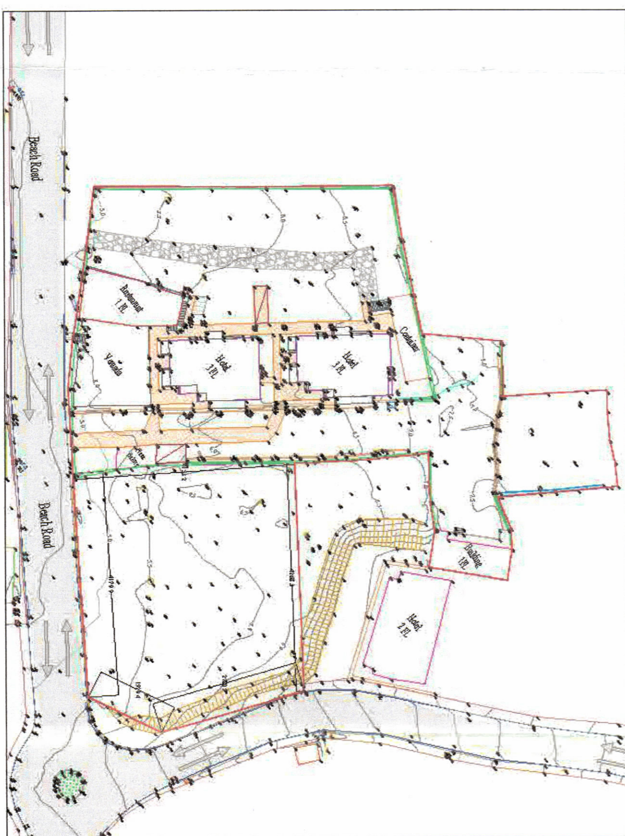
HARTA TOPOGRAFIKE SHK. 1:500

TREGUESITË E ZHVILLIMIT: Sipërfaqe e përgjithshme e truallit: 5899m 2 Sipërfaqe e truallit e zënë nga anekshura (gjurmë): 2077 fm 2 (plus godinat ekzistuese) 4492m 2 Sipërfaqe e përgjithshme e ndërimit: 5899m 2 (plus godinat ekzistuese) 4492m 2 Kondicioni i ndërtimit të truallit për ndërtim: 39% Kondicioni i ndërtimit të truallit për rrugë dhe hapësira publike: 65% Intensiteti i ndërtimit: 0.76 Lartësia maksimale e strukturës nga niveli i kështjës së sistemit: 17.2m Lartësia maksimale e strukturës nga niveli i kështjës së sistemit: 3 Kat Numri i katëve nga toka: 1 Kat