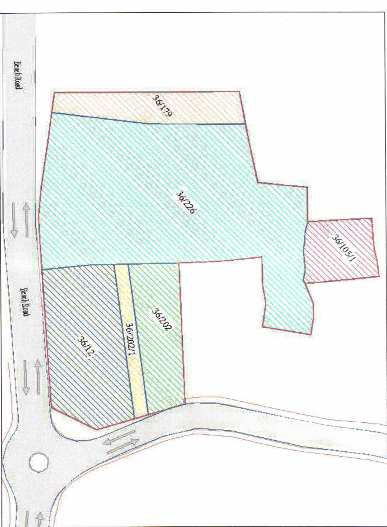
POZICIONI KADASTRAL SHK. 1:500