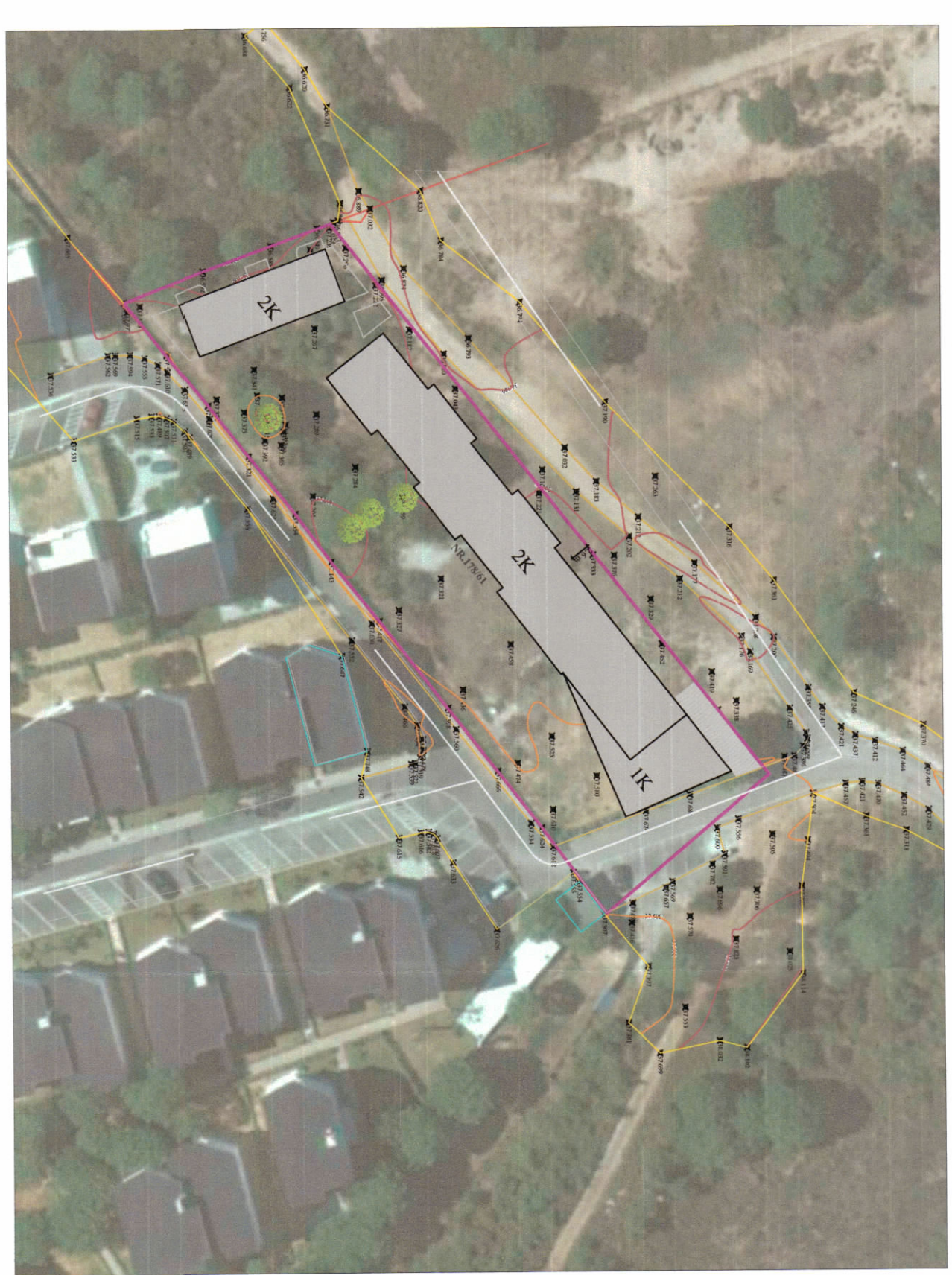
HARTA TOPOGRAFIKE SHK. 1:750

TREGUESIT E ZHVILLIMIT: Sipërfaqe e përgjithshme e truallit: 2756 m 2 Sipërfaqe e truallit e zënë nga struktura (gjurma): 923 m 2 Sipërfaqe e përgjithshme e ndërtimit: 1710.5m 2 Koeficienti i shfrytëzimit të truallit për ndërtim: 33% Intensiteti i ndërtimit: f=1/62 Lartësia maksimale e strukturës nga niveli i kuadër së sistemit: +7.50 m Numri i katëve mbi tokë: 2KT Numri i katëve nën tokë: 1KT