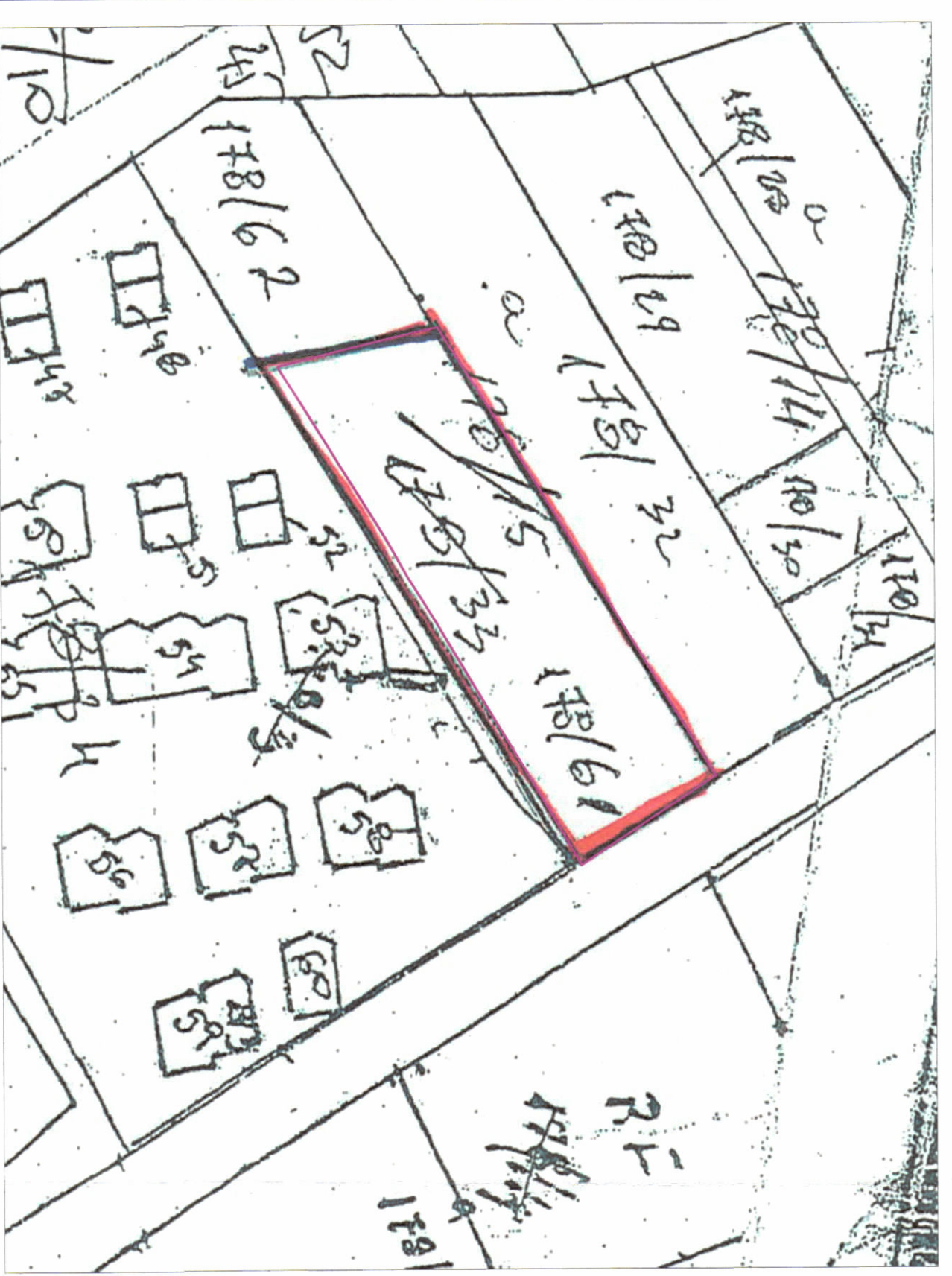
POZICIONI KADASTRAL SHK. 1:1000