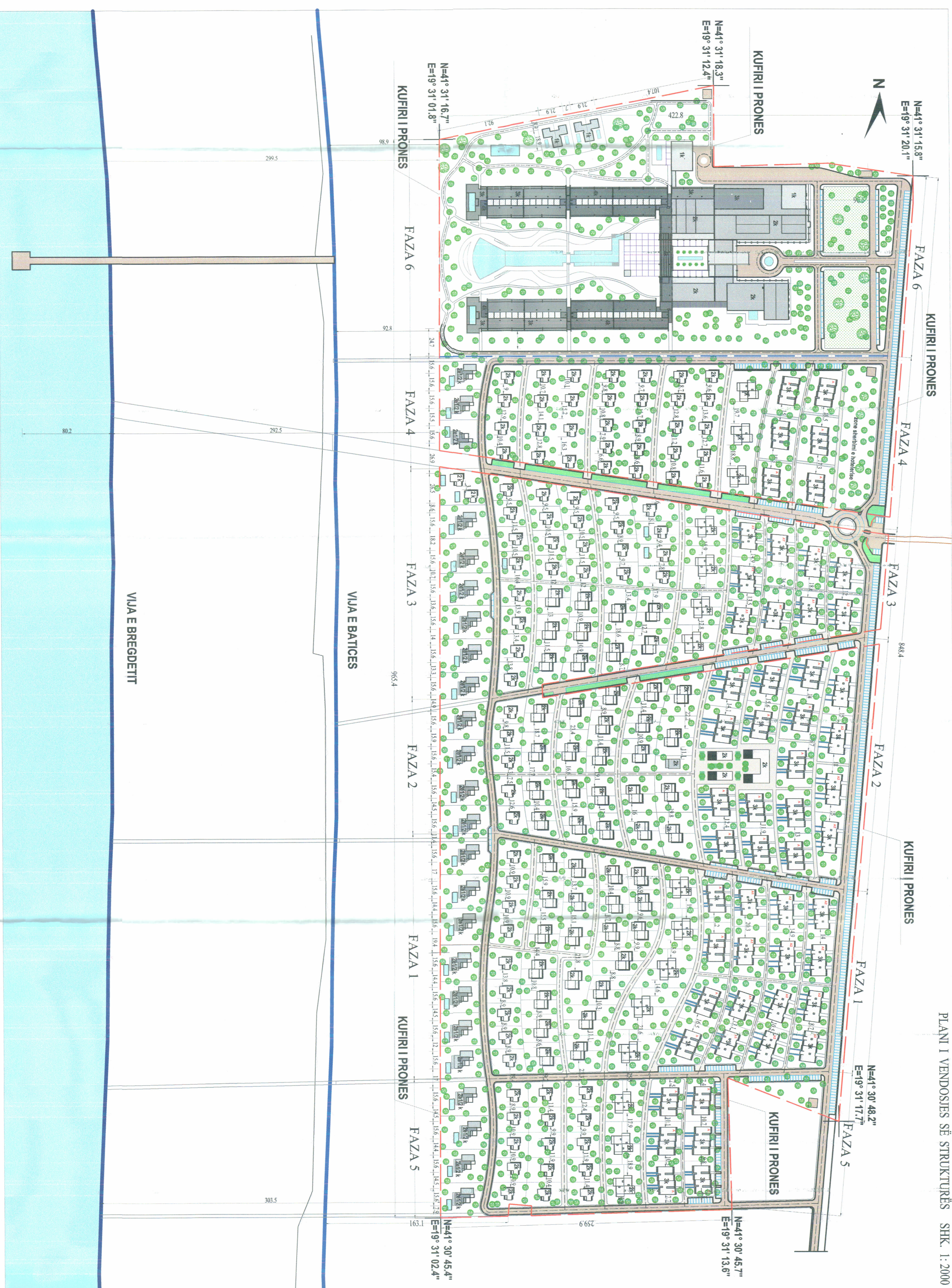
PLANI I VENDOSJES SË STRUKTURËS SHK. 1:2000