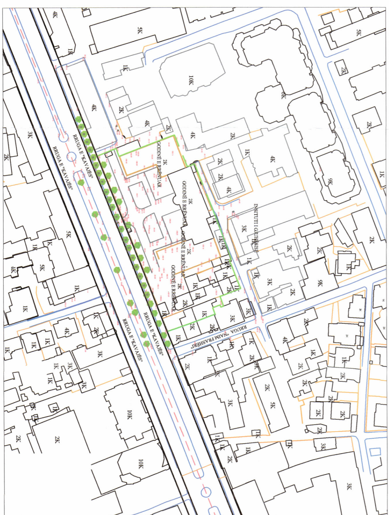
HARTA TOPOGRAFIKE SHK. 1:1000