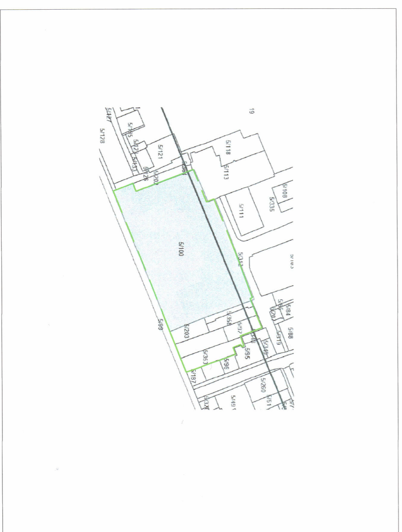
POZICIONI KADASTRAL SHK. 1:1000