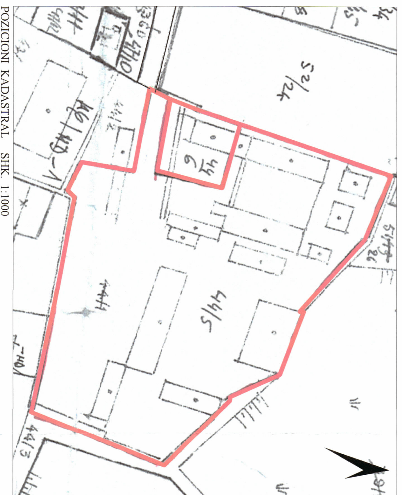
POZICIONI KADASTRAL SHK. 1:1000