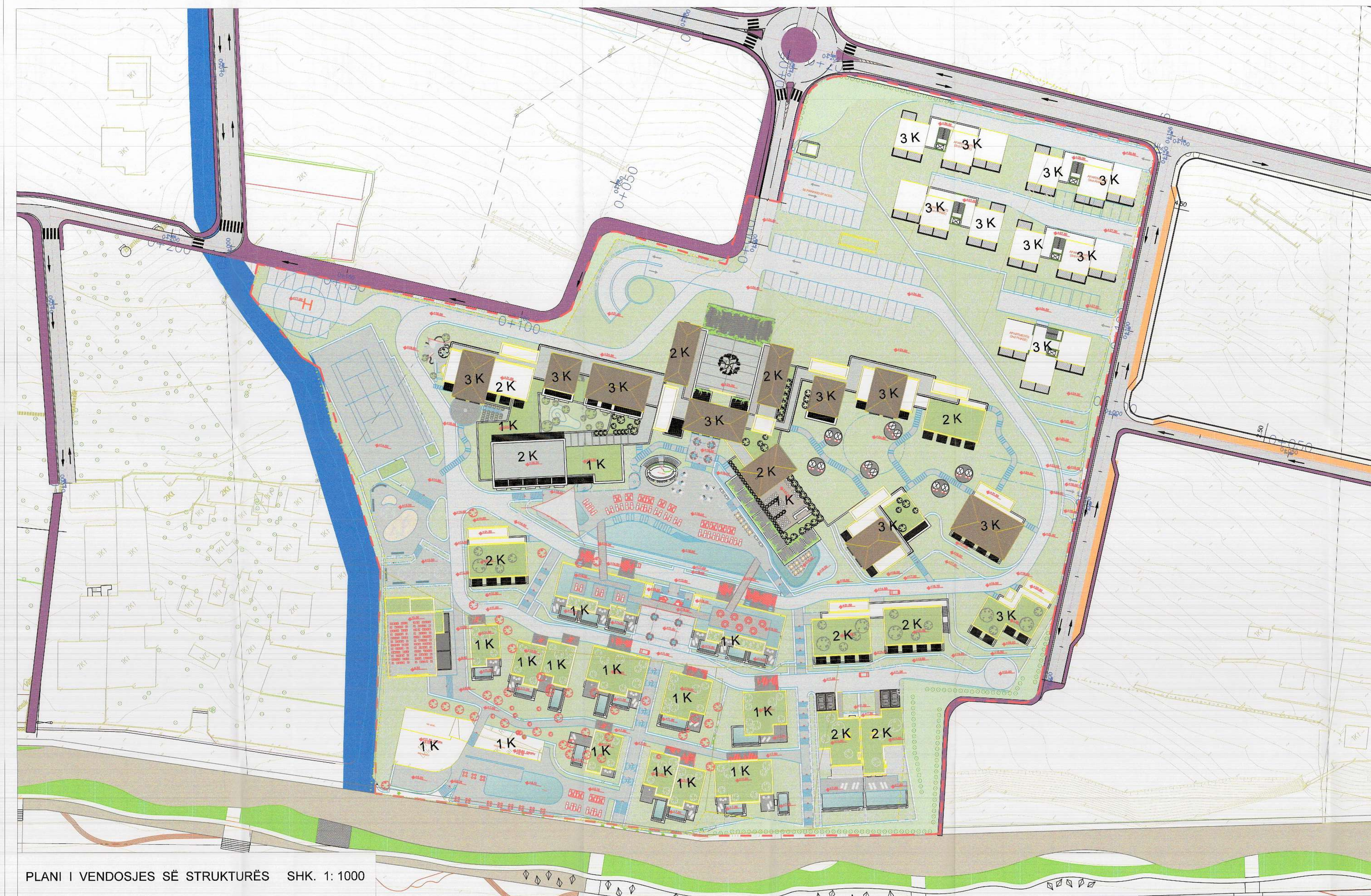
PLANI I VENDOSJES SË STRUKTURËS SHK. 1: 1000