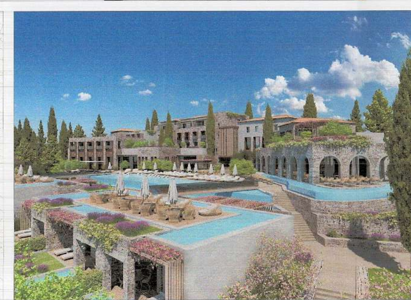
TREGUESIT E ZHVILLIMIT: