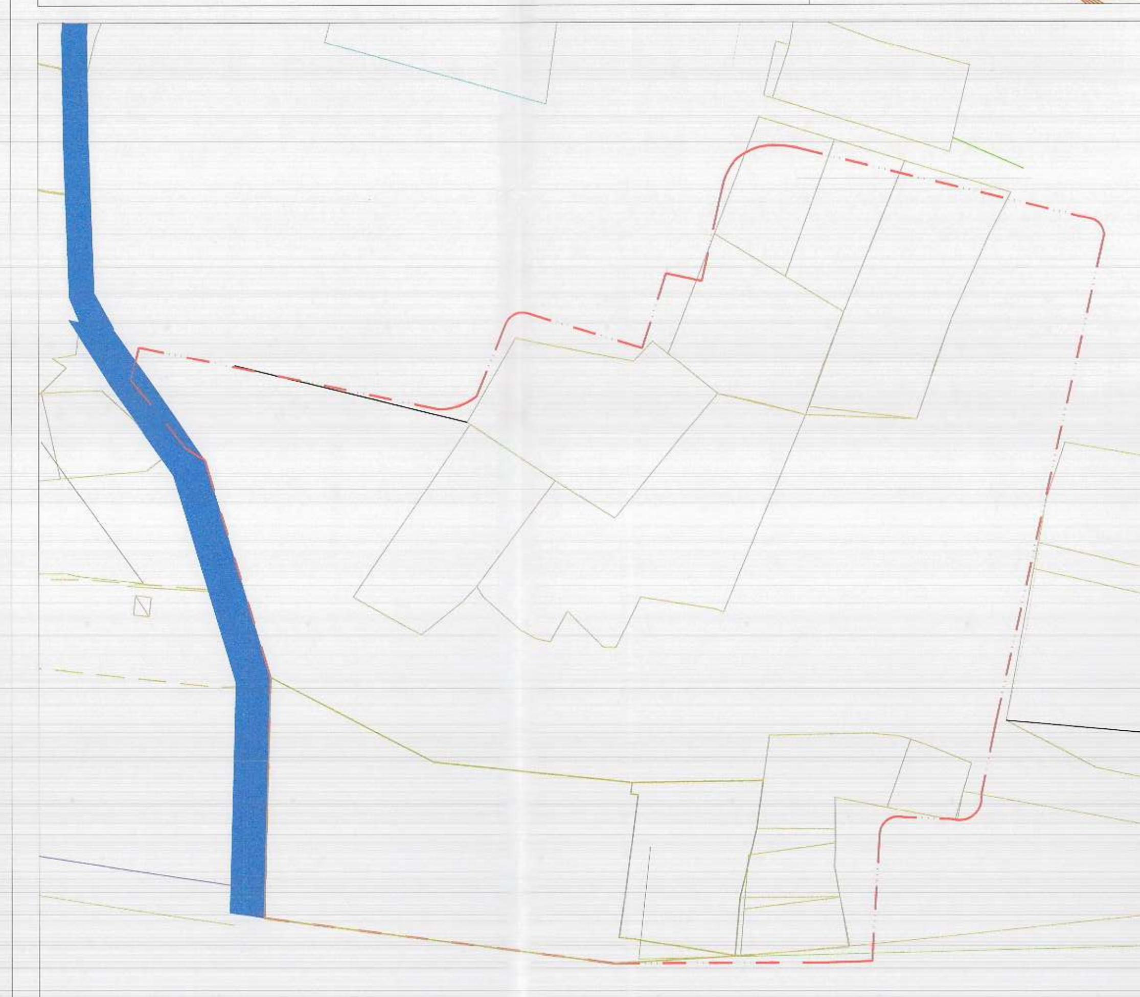
POZICIONI KADASTRAL SHK. 1:1000