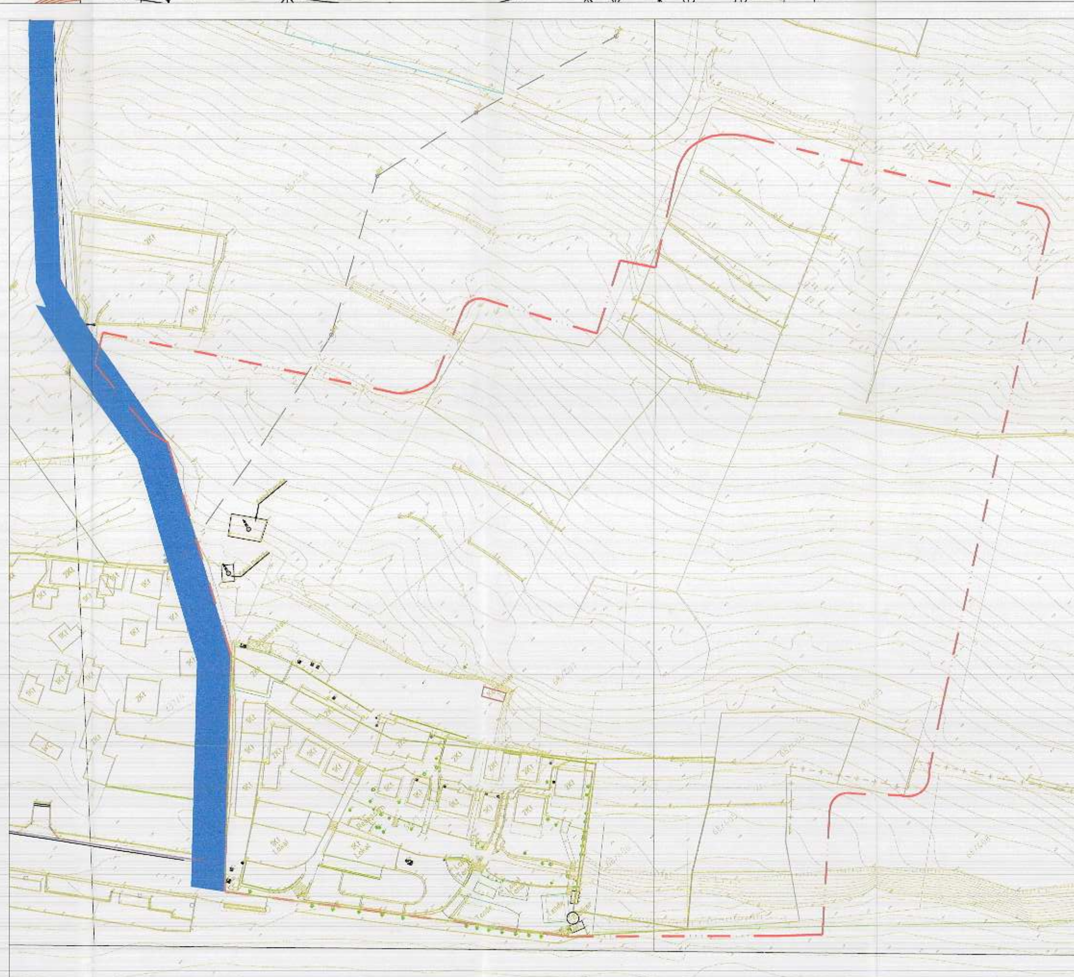
HARTA TOPOGRAFIKE SHK. 1:1000