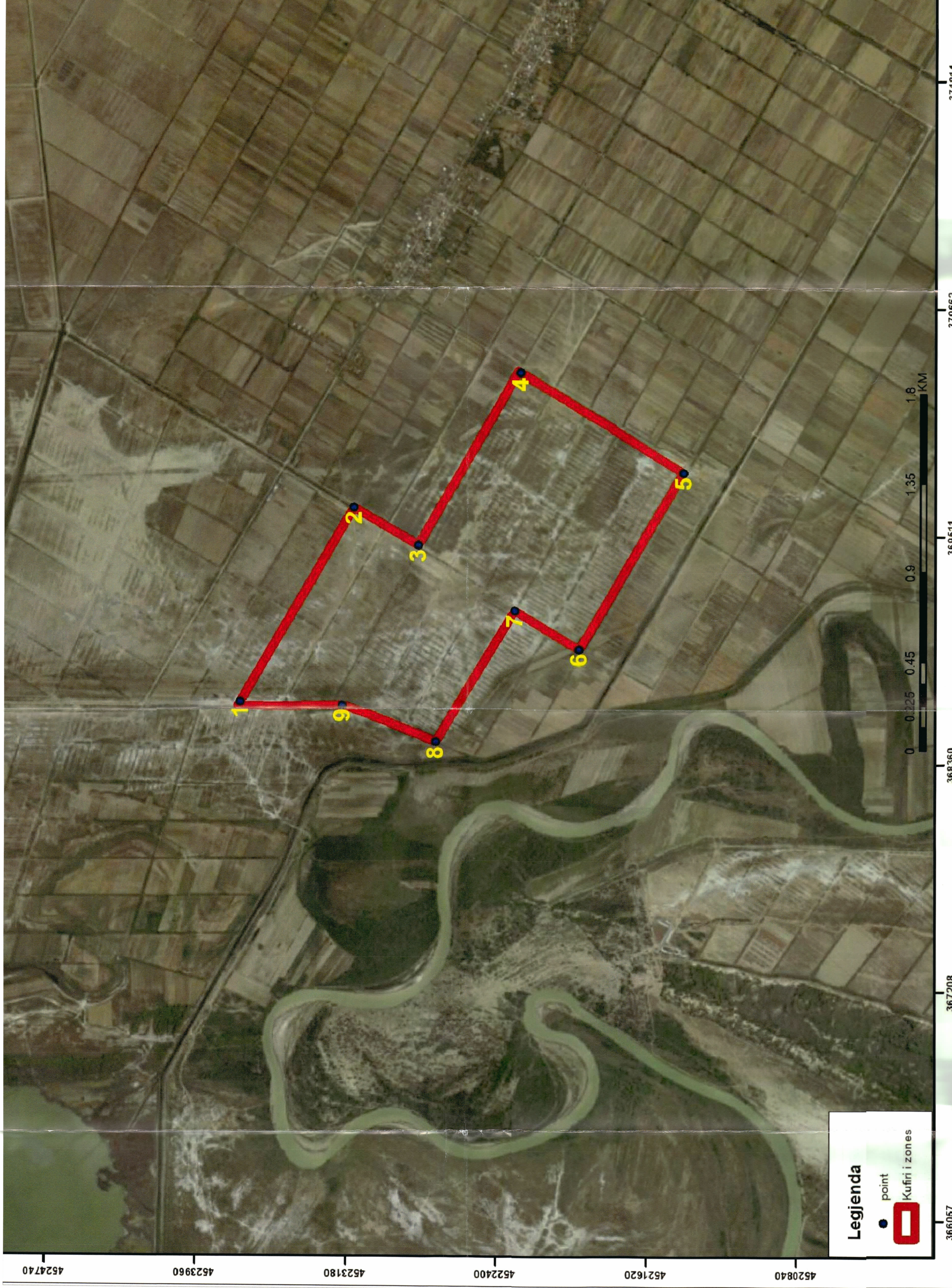
PLANI I VENDOSJES SË STRUKTURËS SHK. 1: 10000