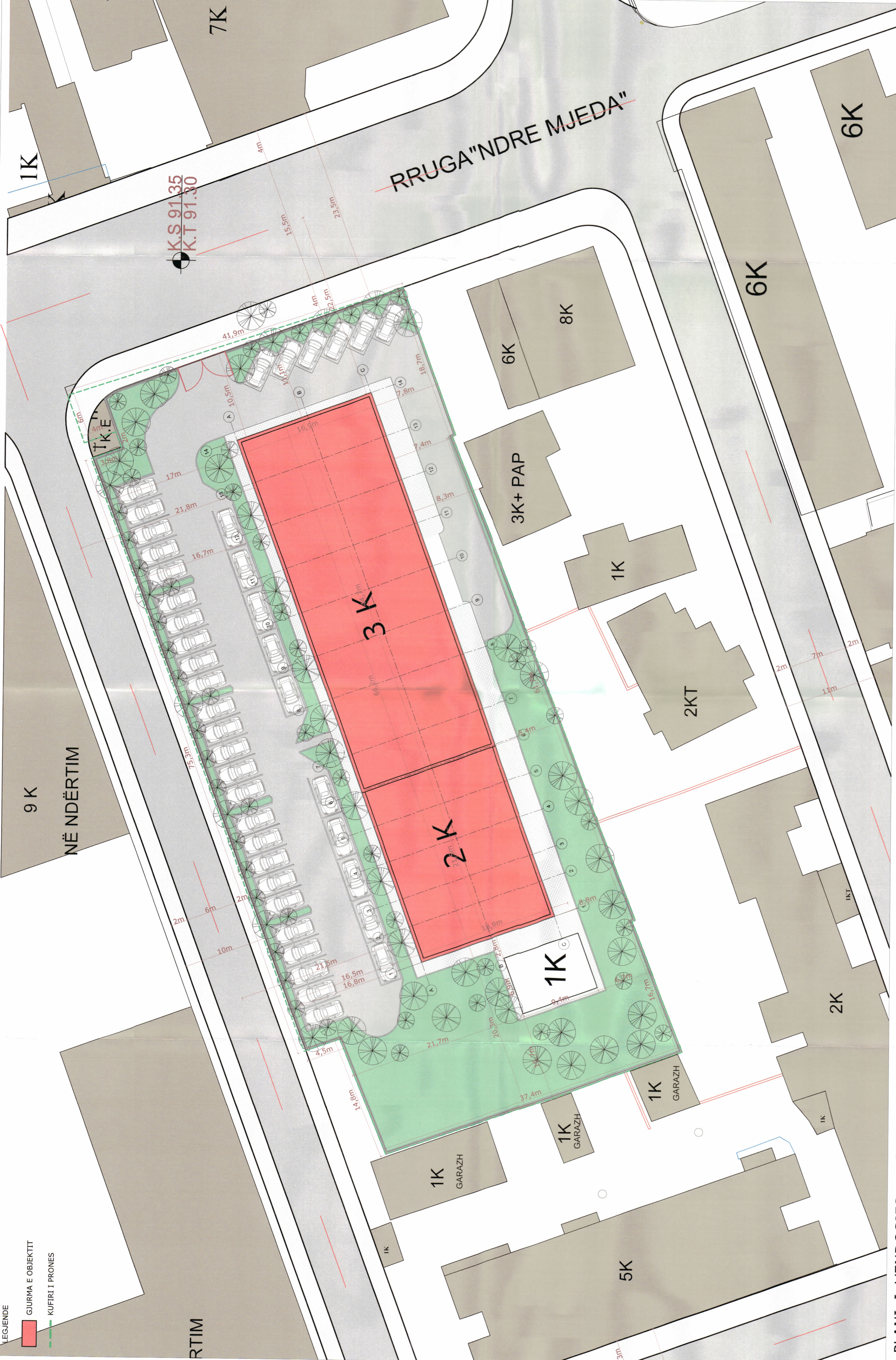
PLANI I VENDOSJES SHK. 1: 250