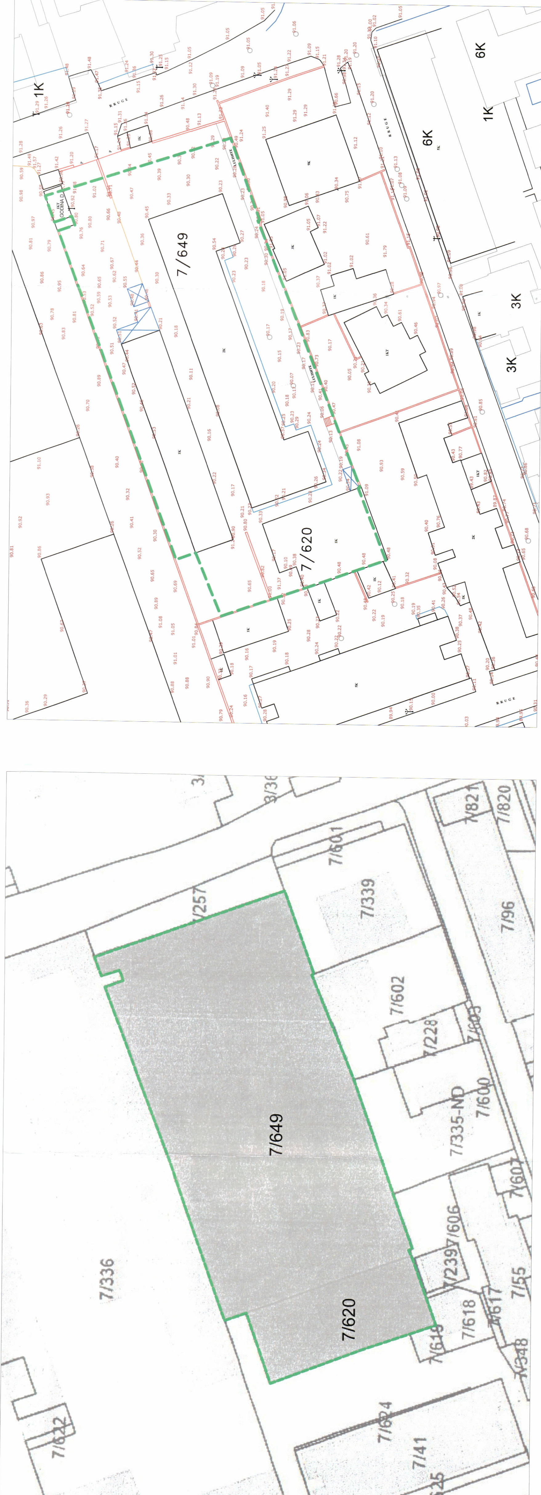
RILEVIMI TOPOGRAFIKE SHK. 1: 500