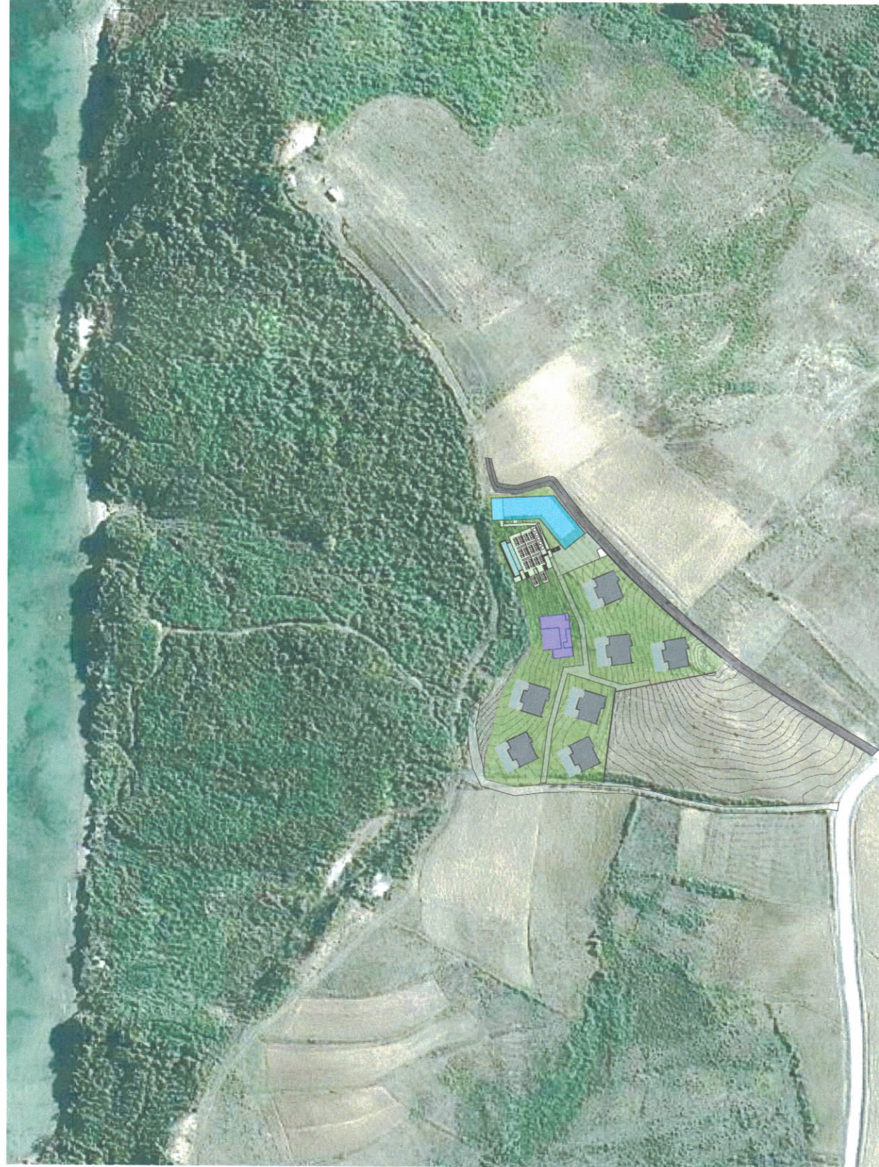
HARTA TOPOGRAFIKE SHK. 1:2000

TREGUESIT E ZHVILLIMIT: Sipërfaqe e përgjithshme e truallit: 10.000 m 2 Sipërfaqe e truallit që përdoret për zhvillim: 10.000 m 2 Sipërfaqe e truallit e zënë nga struktura (gjurma): 1.993 m 2 Sipërfaqe e përgjithshme e ndërtimit: 3.522 m 2 Koeficienti i shfrytëzimit të truallit për ndërtim: 19,93 % Koeficienti i shfrytëzimit të truallit për rrugë dhe hapsira publike: 11,80 % Intensiteti i ndërtimit: 0,35 Lartësia maksimale e strukturës nga niveli i kuotës së sistemit: 1 kt - 2 kt Numri i kateve mbi tokë: 0 - 1 kt Numri i kateve nën tokë: