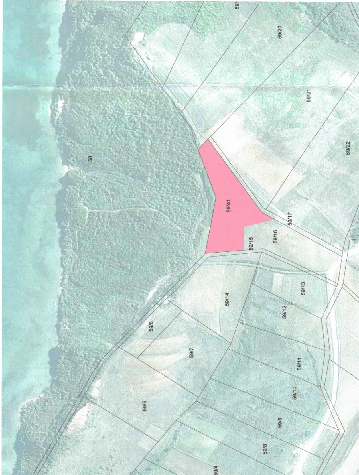
POZICIONI KADASTRAL SHK. 1:2000