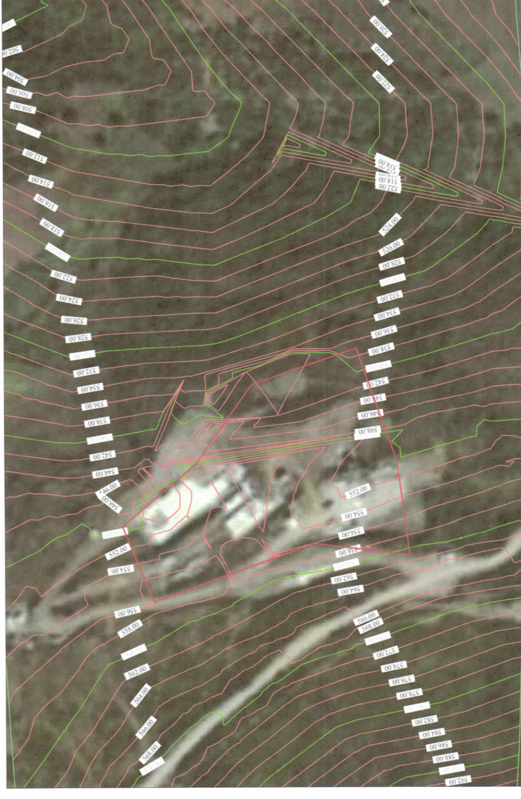
HARTA TOPOGRAFIKE SHK. 1:2000