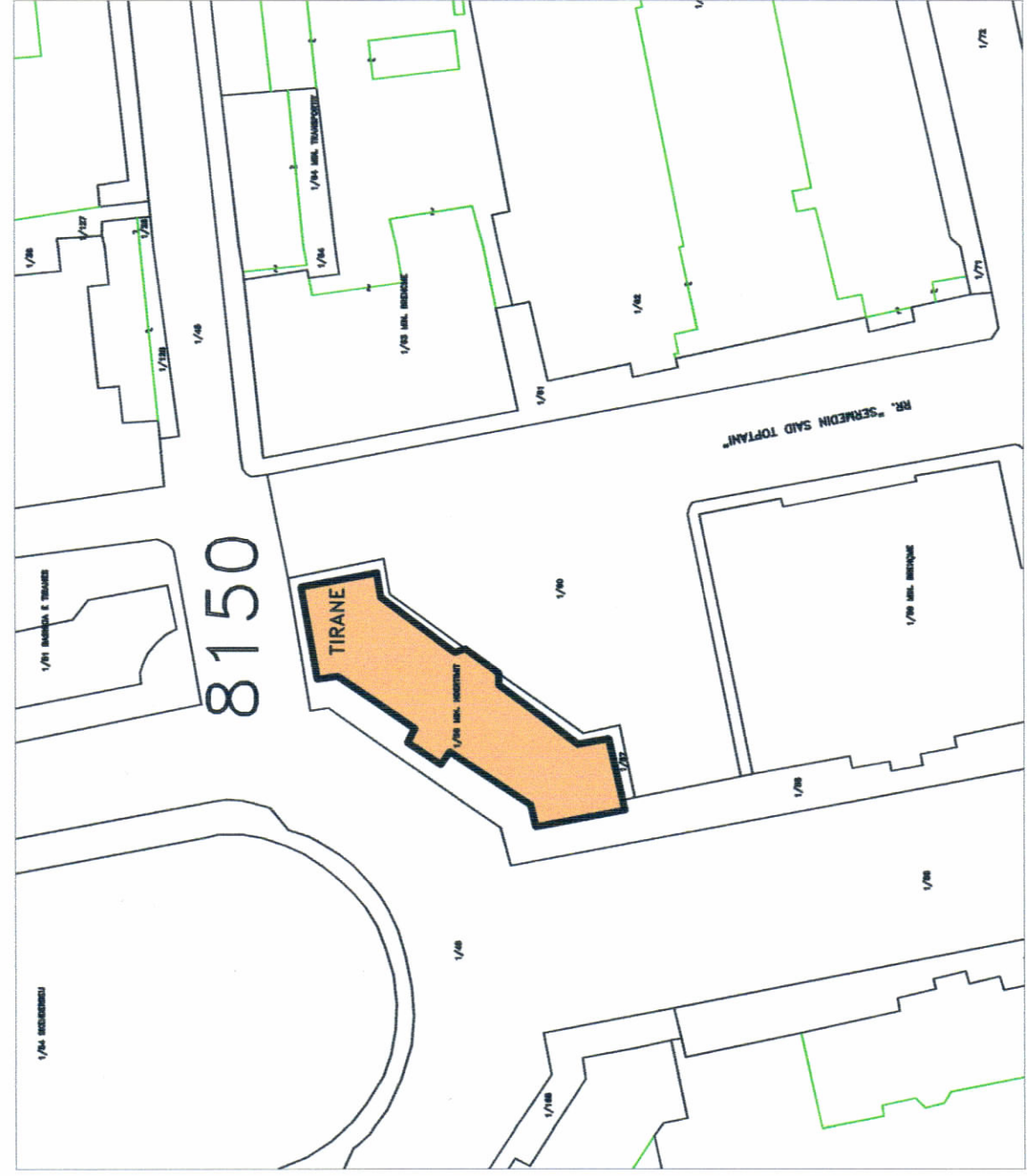
POZICIONI KADASTRAL SHK. 1:1000