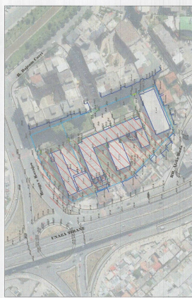
POZICIONI KADASTRAL SHK. 1:2000