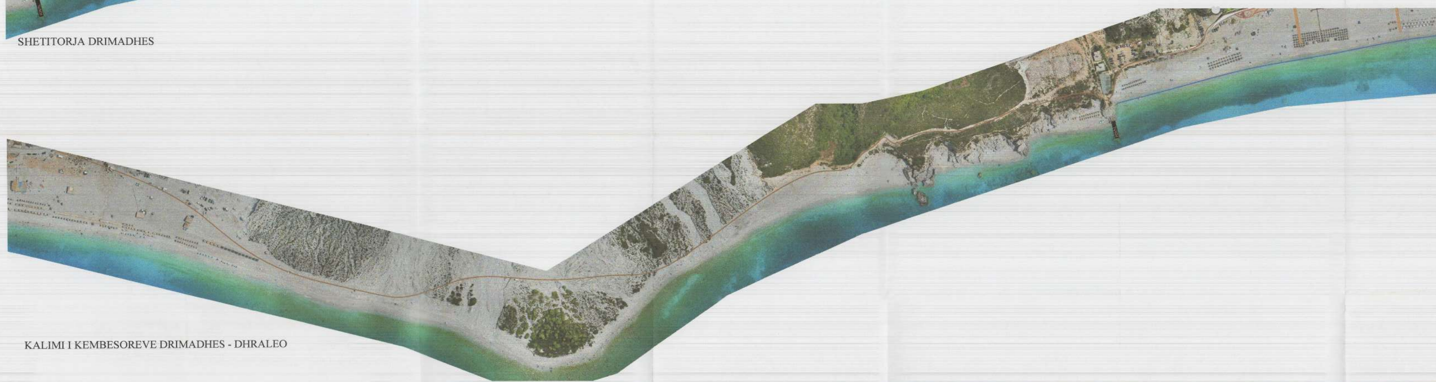
KALIMI I KEMBESOREVE DRIMADHES - DHRALEO