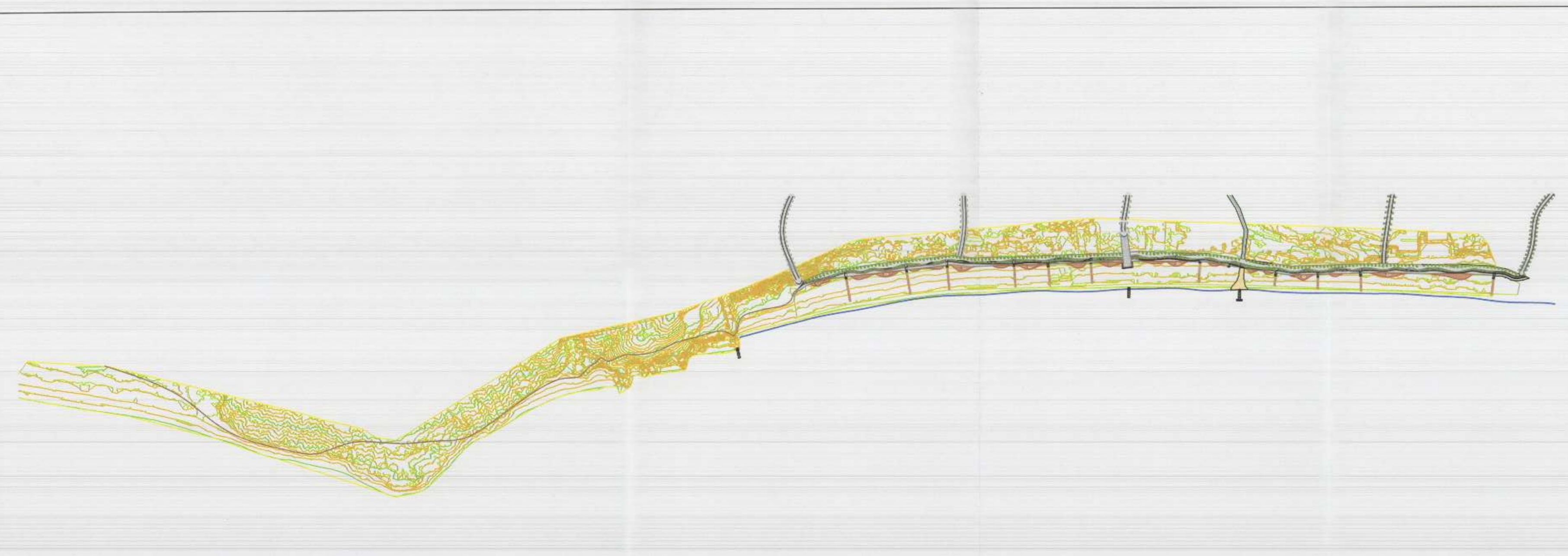
HARTA TOPOGRAFIKE SHK. 1:5000