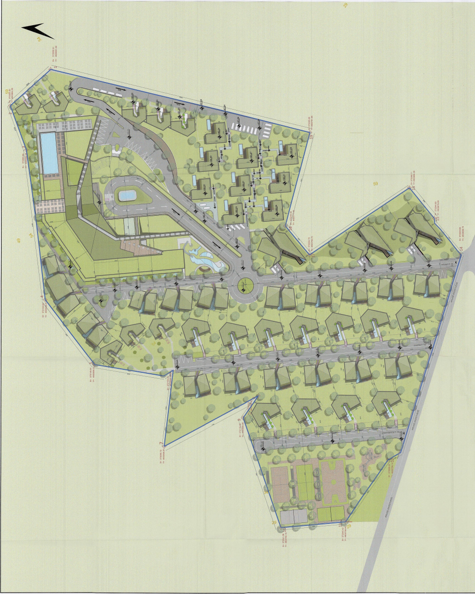
PLANI I VENDOSJES SE STRUKTURES SHK. 1:500