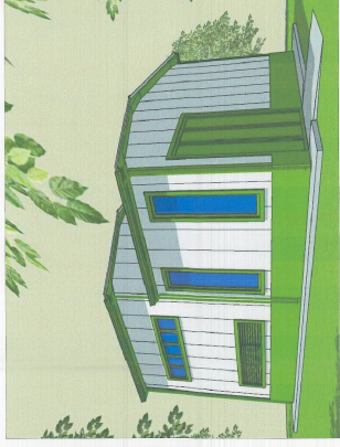
PANJUE 3 DIMENSIONALE E GODINËS CENTRALIT