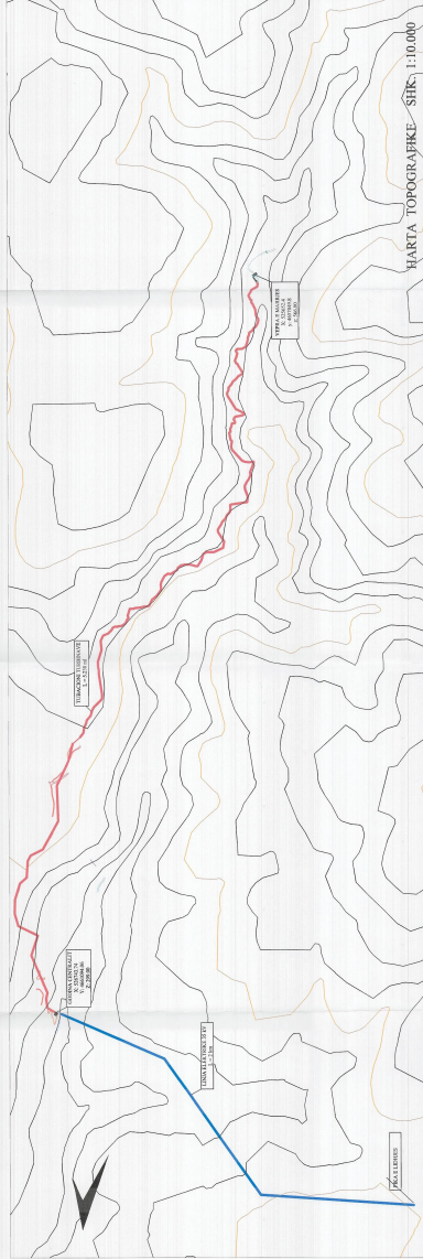
KARTA TOPOGRAFIKE SHK. 1:10,000