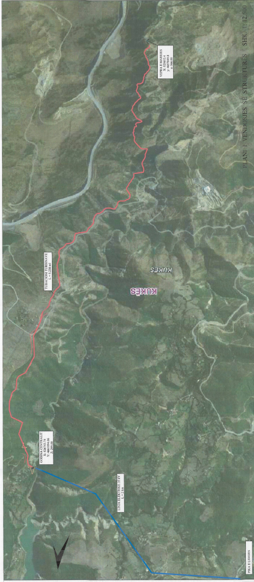
PLANI I VENDOSJES SË STRUKTURËS SHK. 1:12,500