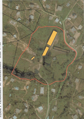
POZICIONI KADASTRAL SHK. 1:3000