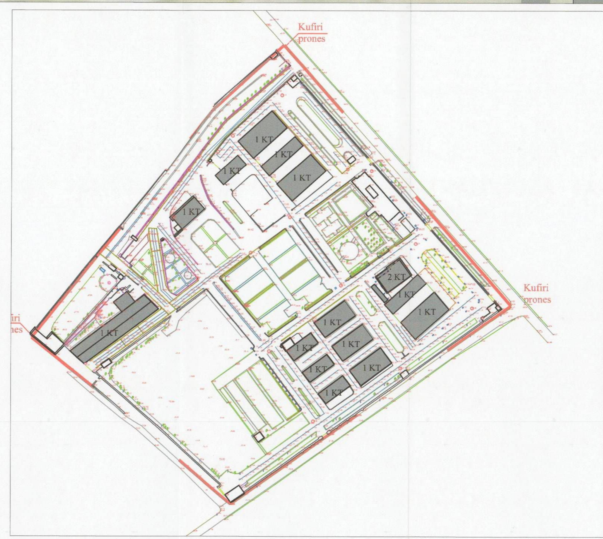
HARTA TOPOGRAFIKE SHK. 1:1500