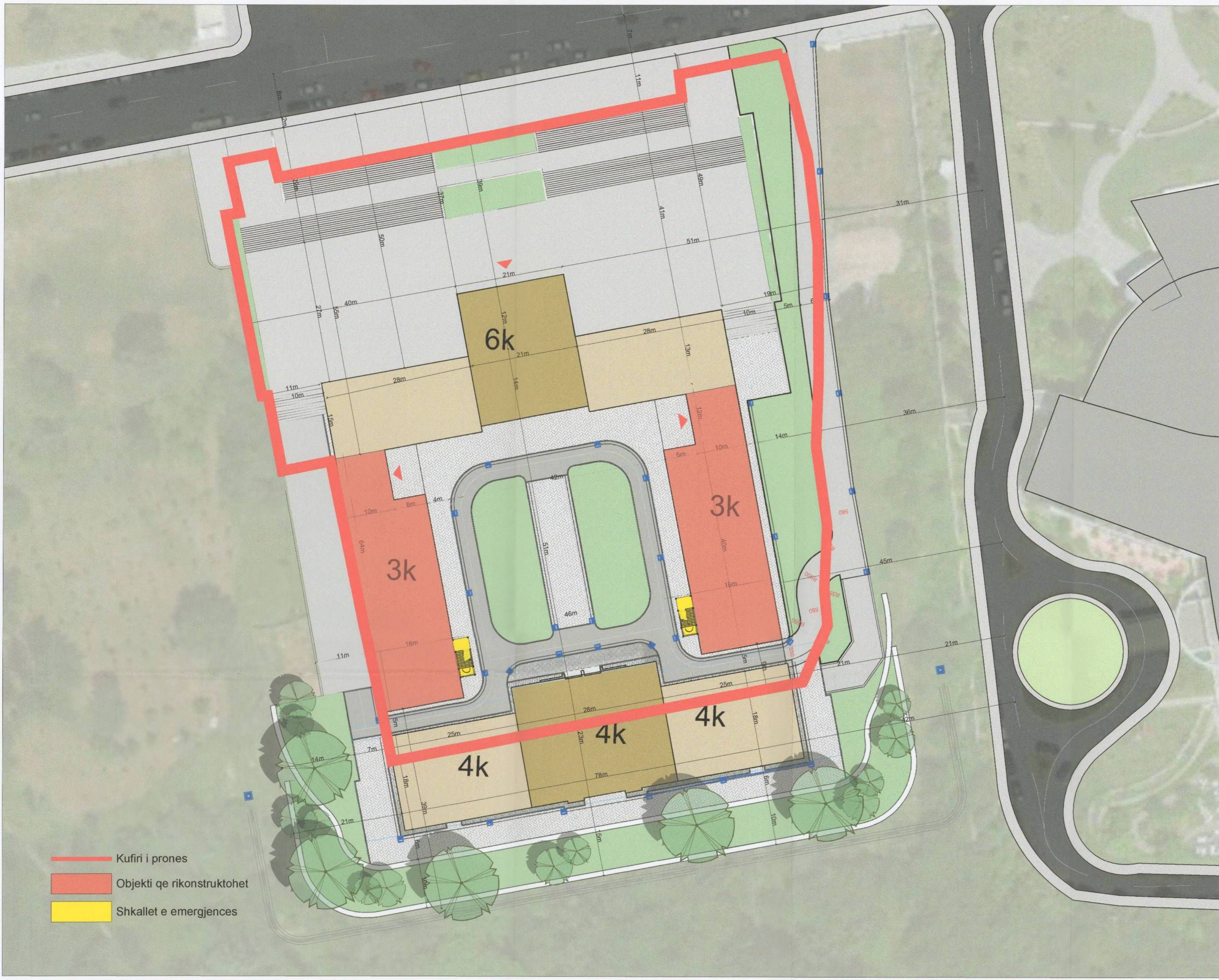
PLANI I VENDOSJES SË STRUKTURËS SHK. 1:500