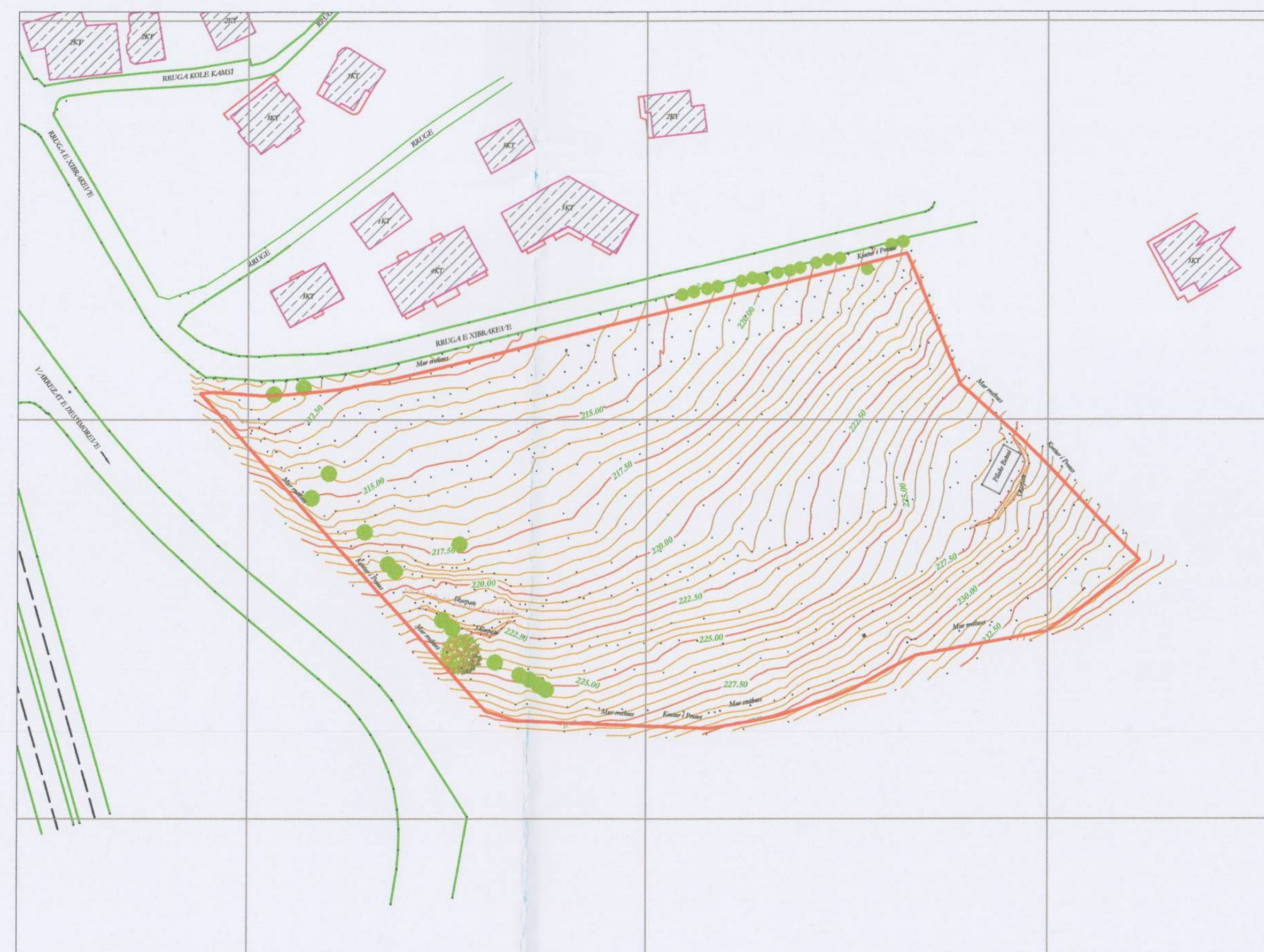
HARTA TOPOGRAFIKE SHK. 1:1000