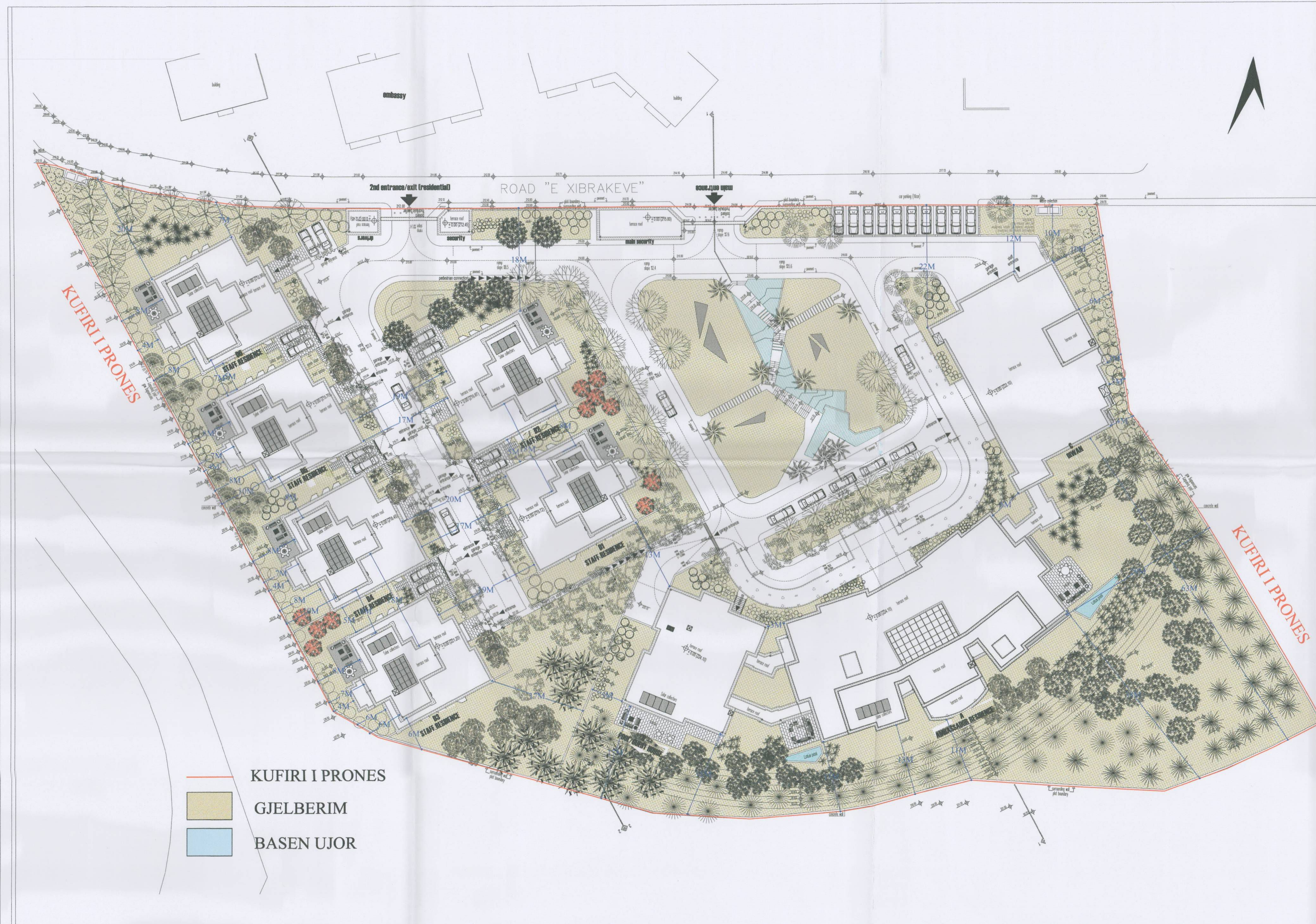
PLANI I VENDOSJES SË STRUKTURËS SHK. 1:4000