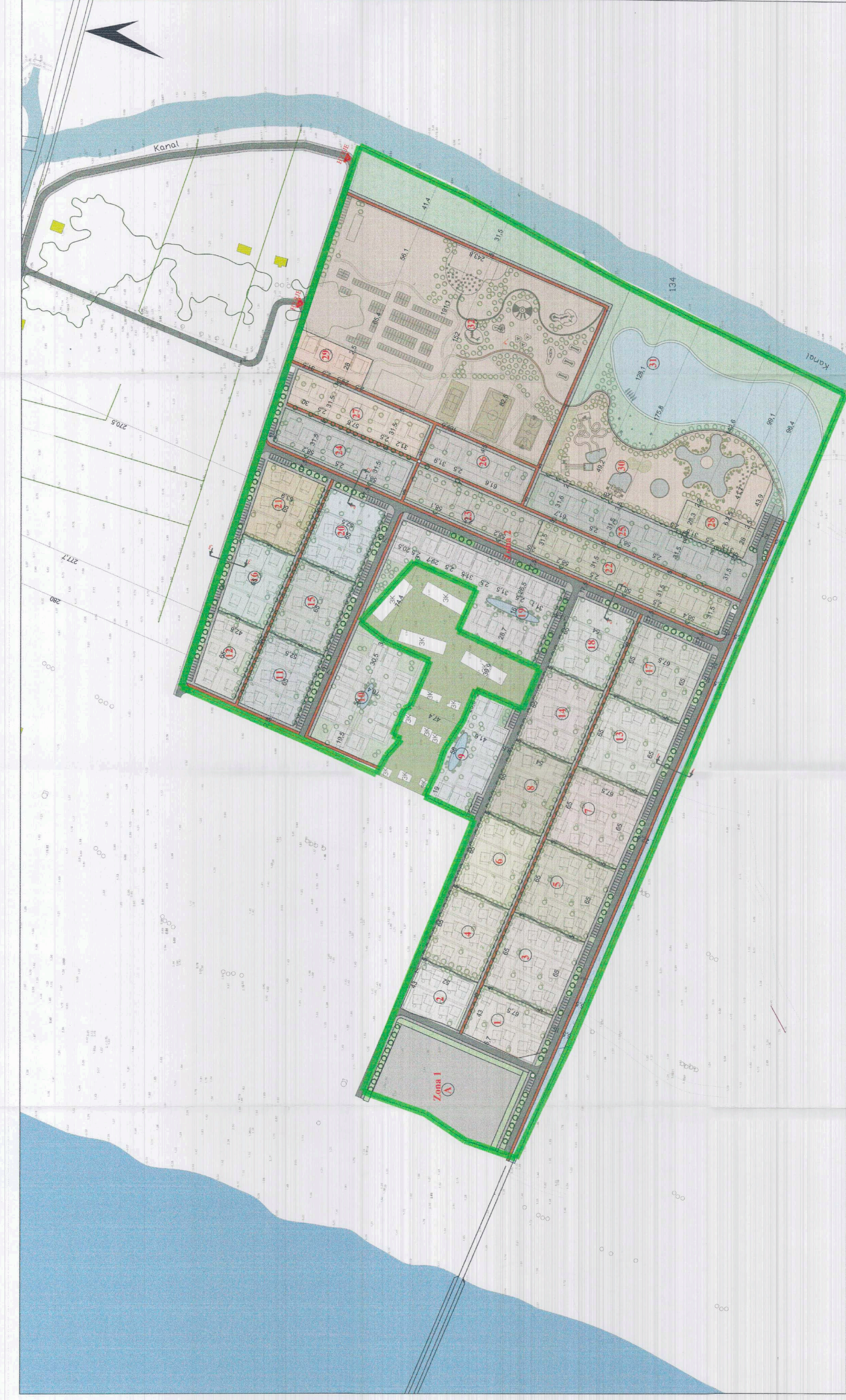
PLANI I VENDOSJES SË STRUKTURËS SHK. 1: 1000