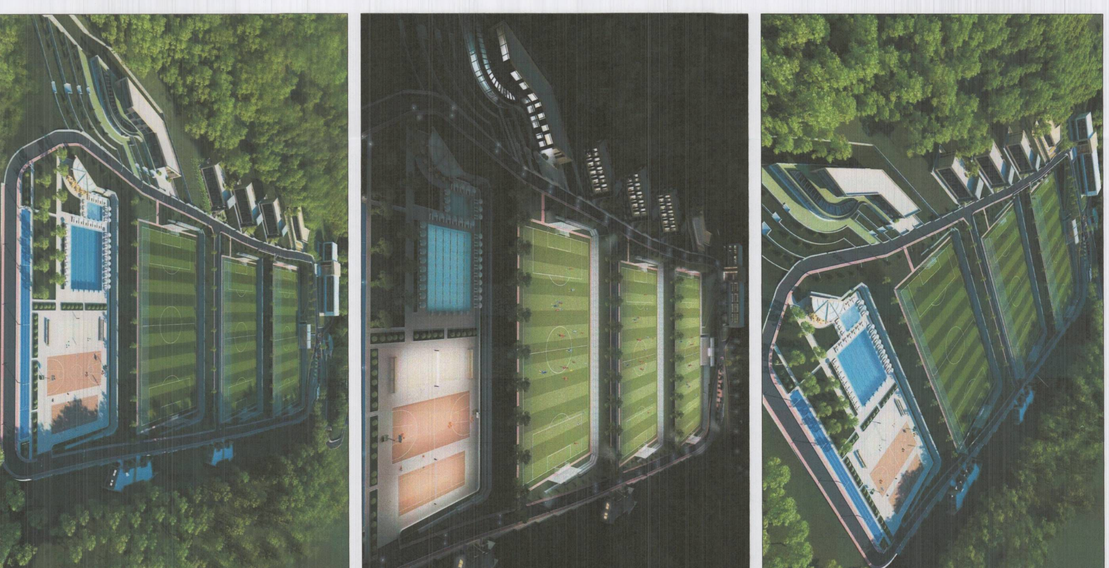
PLANI I VENDOSIES SË STRUKTURES SHK. 1: 750