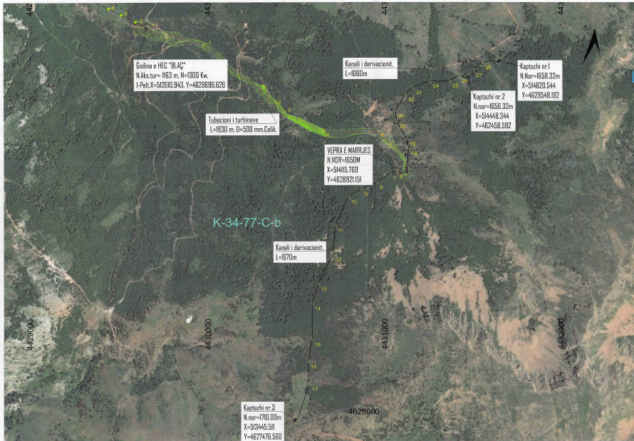
PLANI I VENDOSJES SË STRUKTURËS SHK. 1: 5000