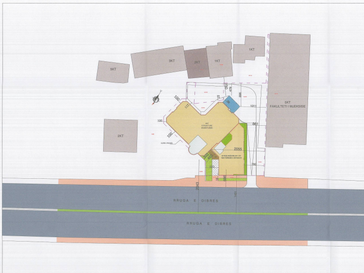
PLANI I VENDOSJES SË STRUKTURËS SH 1:500