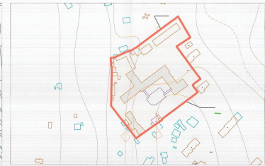
HARTA TOPOGRAFIKE SHK. 1:2000

TREGUESI E ZHVILLIMIT: Sipërfaqe e përgjithshme e truallit brenda murit rrethues të spitalit: 18000m 2 3967m 2 607,5m 2 Sipërfaqe e truallit e zotëruar nga struktura ekzistuese: 3234,5m 2 Sipërfaqe totale e truallit e zotëruar nga struktura e re (gjuetja): 1215m 2 Sipërfaqe e përgjithshme e ndërimit të ri (plotë kufiri): 9,10M Lartësia maksimale e strukturës nga niveli i kuzës së sistemit: Numri i katëve në tërësi ndërimit i ri: 2 1