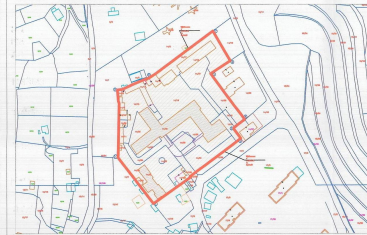
POZICIONI KADASTRAL SHK. 1:2000