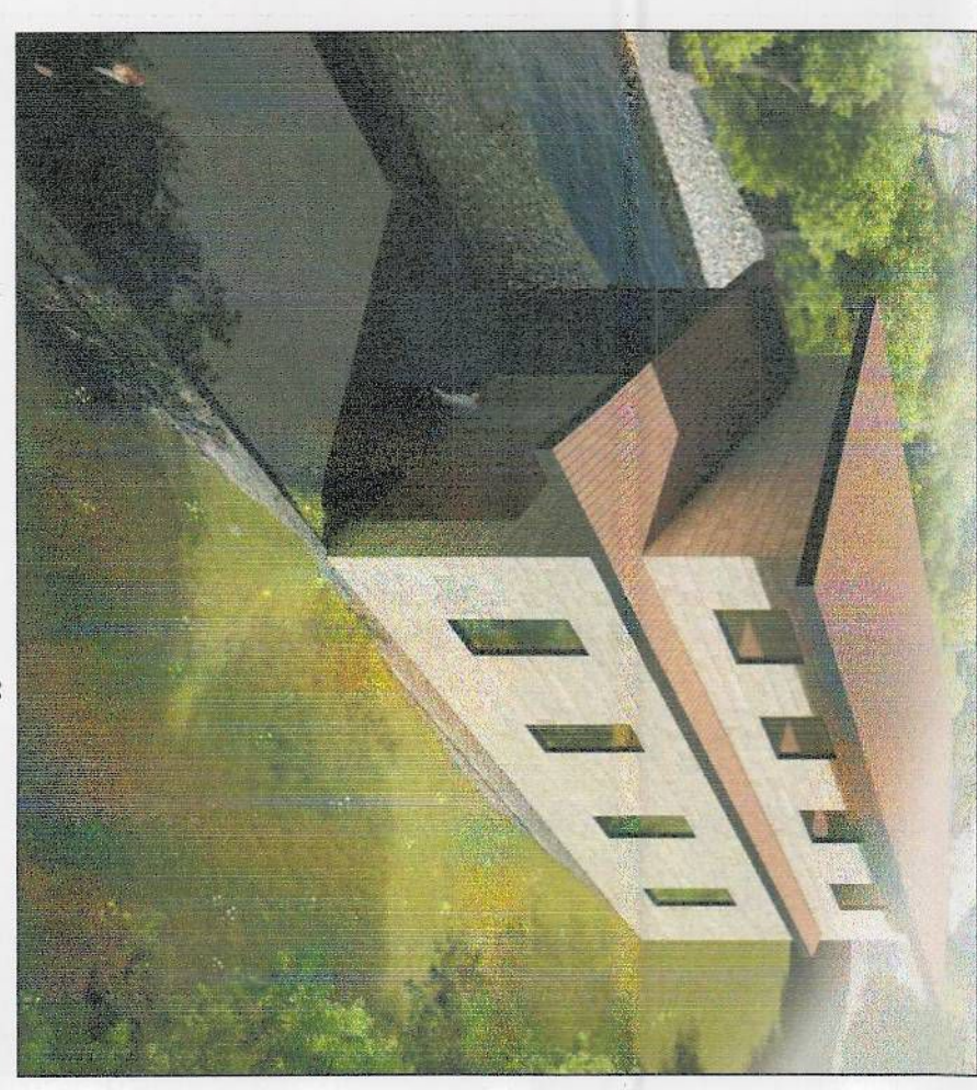
PAMJE NË PERSPEKTIVË GODINA E HECJETONI