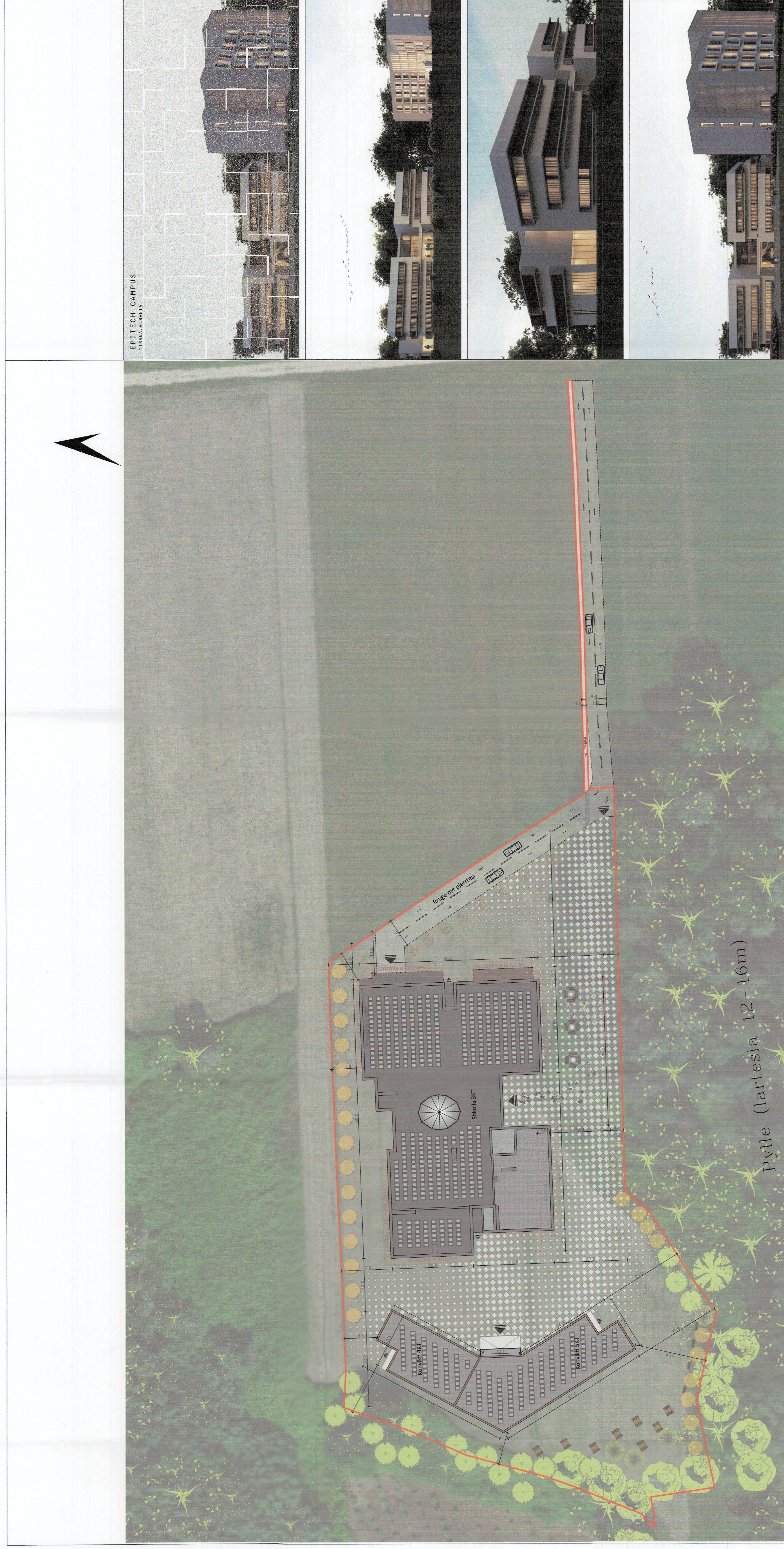
PLANI I VENDOSJES SË STRUKTURËS SHK. 1:400