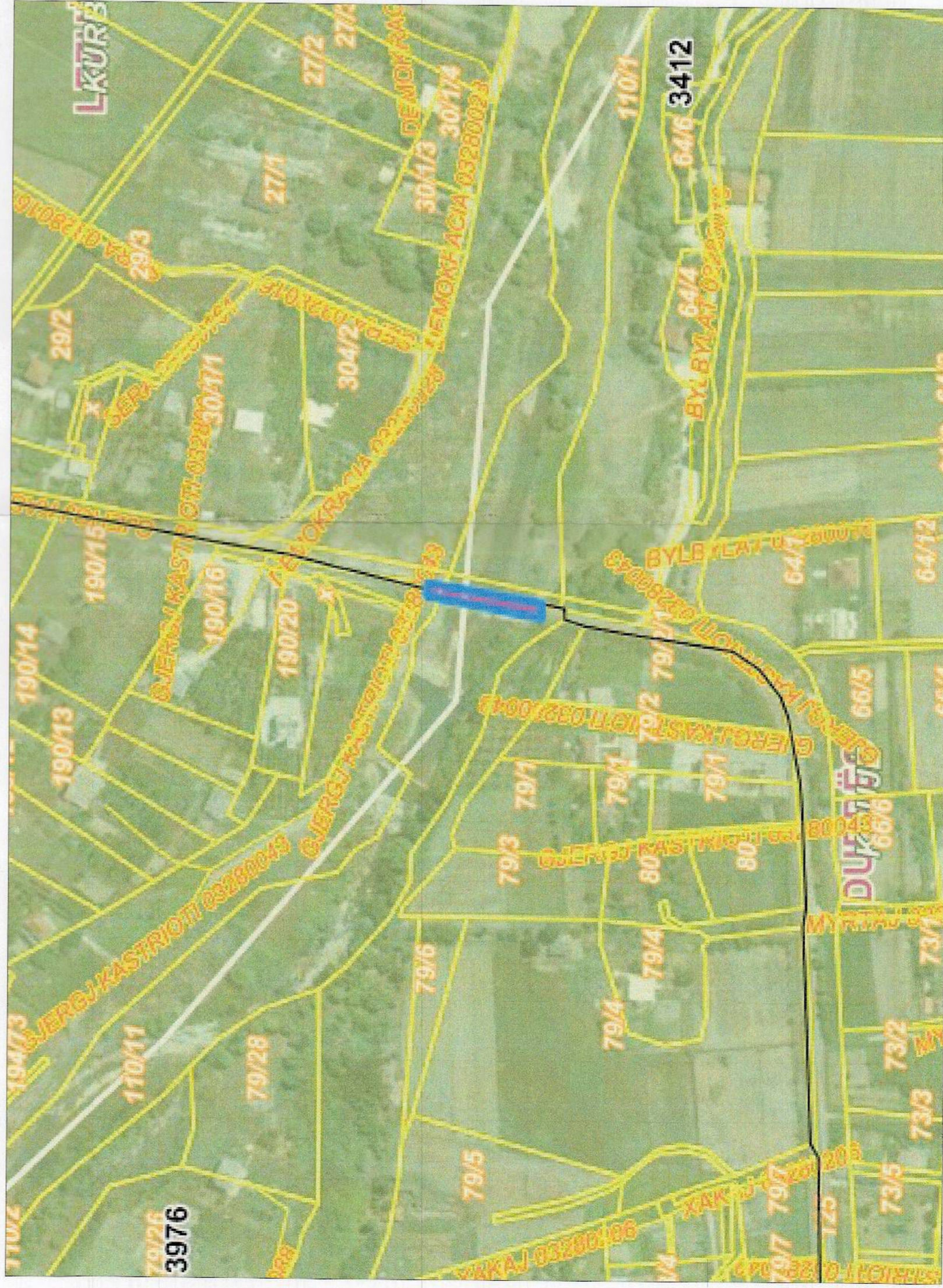
POZICIONI KADASTRAL SHK. 1:2000