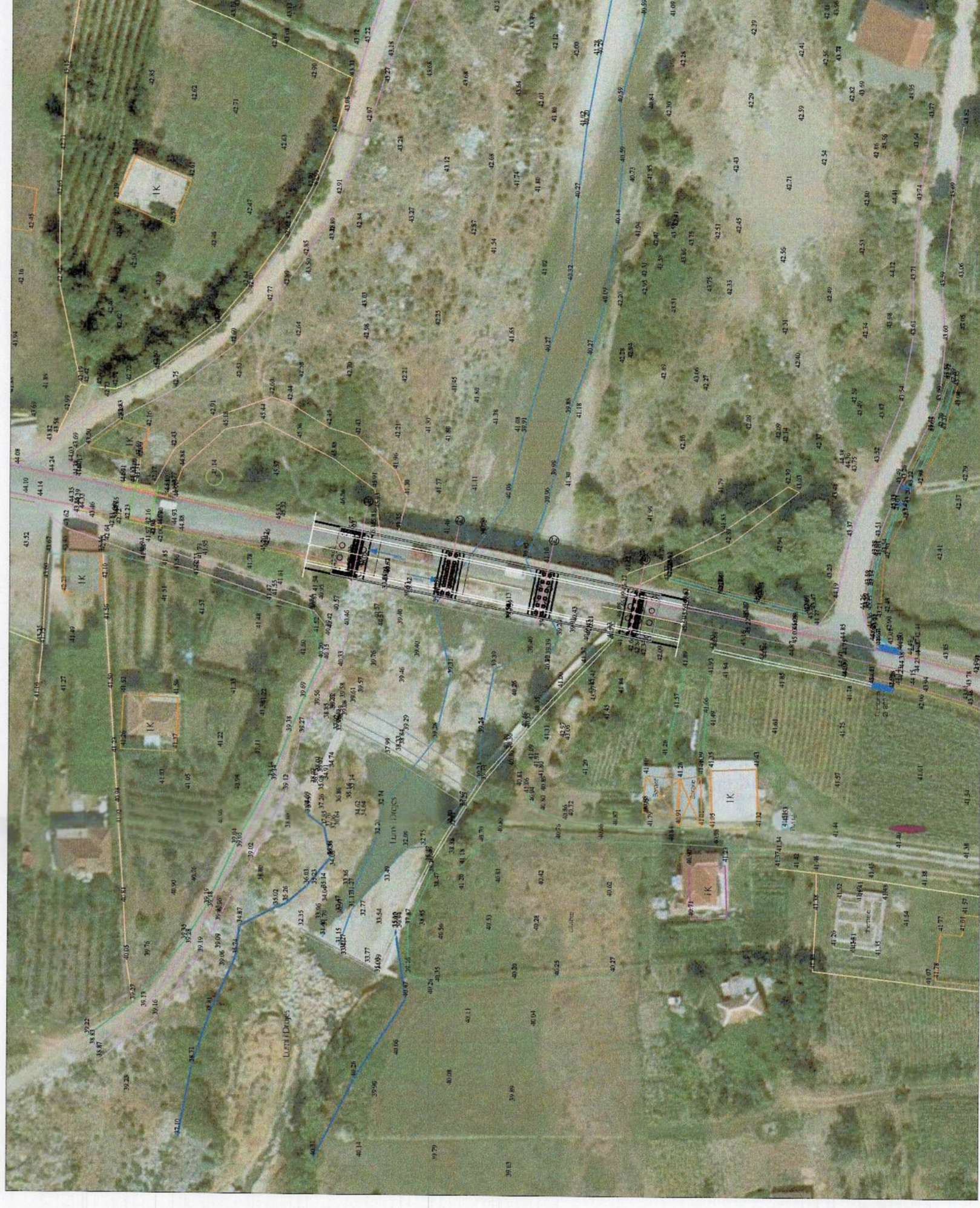
HARTA TOPOGRAFIKE SHK. 1:1000