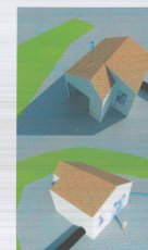
PAMJE 3D GODINES SE HEC-IT SHK. 1:500