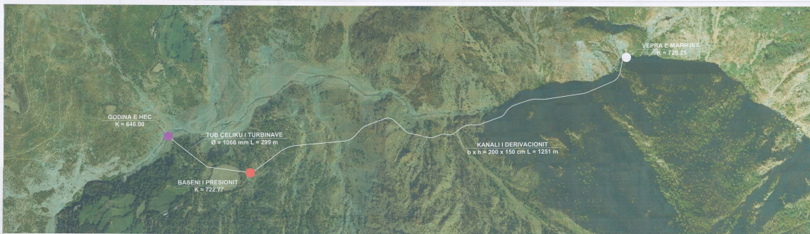
PLANI I VENDOSJES SË STRUKTURËS NE ORTOFOTO SHK. 1:2500