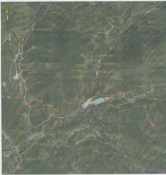
PLANI I VENDOSJES SË STRUKTURËS NË ORTOFOTO SHK. 1:7500