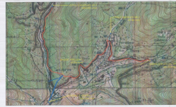
POZICIONI TOPOGRAFIK SHK. 1:20000