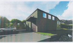
PAMJE NË PERSPEKTIVË GODINA THIRRË