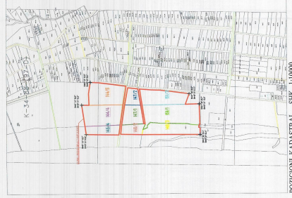
POZICIONI KADASTRAL SHK. I: 1:1000