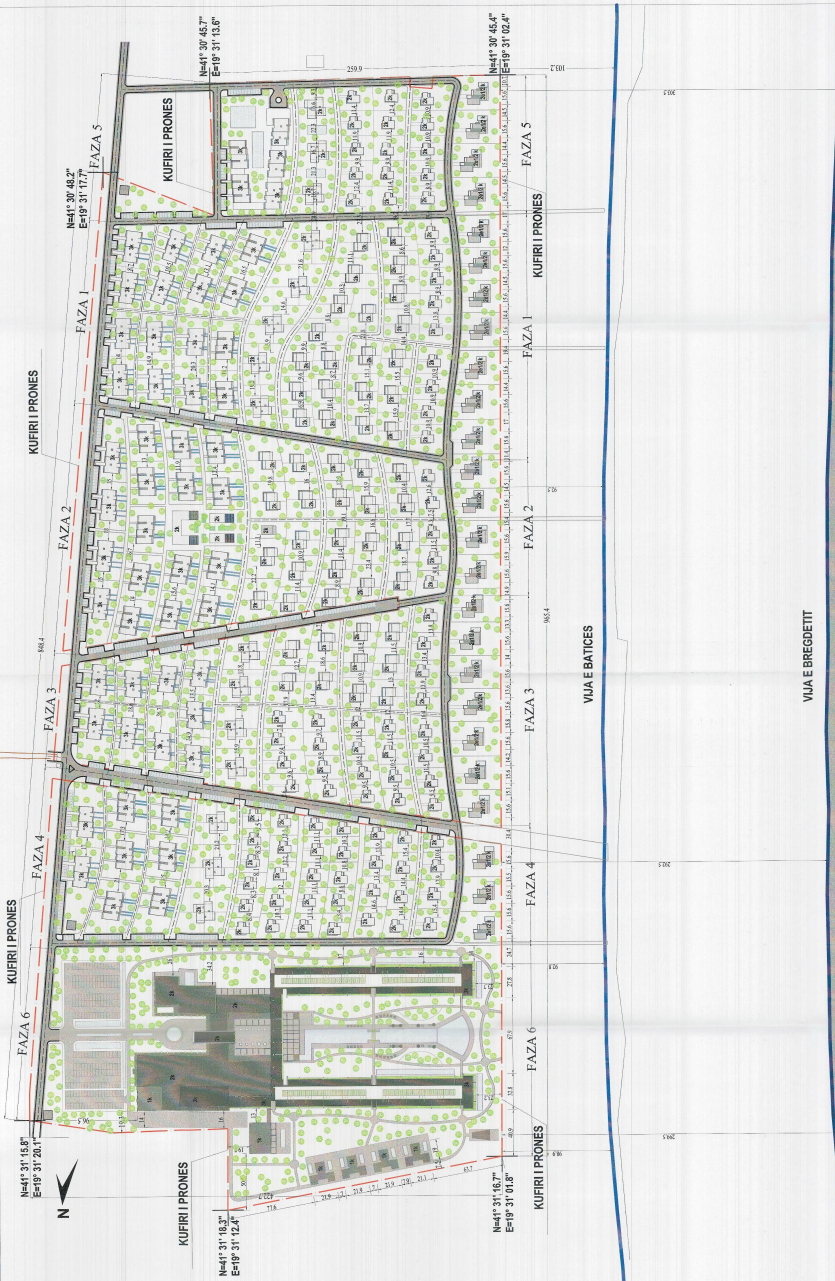
PLANI I VENDOSJES SË STRUKTURËS SHK. I: 1:500