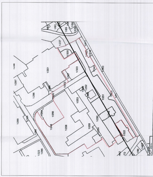
POZICIONI KADASTRAL SHK. 1:750