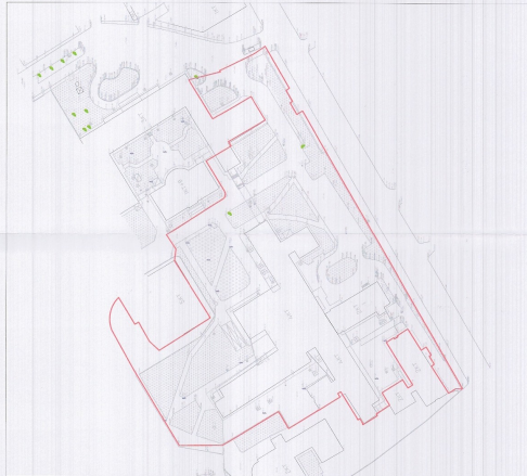
HARTA TOPOGRAFIKE SHK. 1:750

TREKËSHTI E ZHIVILLIMIT: Spacina e rreptazimit në totalit: 11.416 m 2 Spacina e huallit e zone nga struktura ektzistuese (gjurma) 2.052 m 2 Spacina e huallit e ndërtimit nga struktura ektzistuese 7.402 m 2 Spacina e ndërtimit në bashkësi nga struktura ektzistuese 8.352 m 2 Spacina e parqullimit dhe rreptazimit nga struktura ektzistuese 8.255 m 2 Spacina e huallit e zone nga struktura te propozuara (gjurma) 1.420 m 2 Spacina e ndërtimit në bashkësi nga struktura te propozuara 4.532 m 2 Spacina e ndërtimit në bashkësi nga struktura te propozuara 4.432 m 2 Spacina e parqullimit dhe rreptazimit nga struktura te propozuara 6.377 m 2 Koeficienti i shfrytëzimit të huallit për ndërtim: 30,5 % Intensiteti i ndërtimit 1.04 Numri i katëve në bashkësi nga niveli i huadës së ndërtimit: 18,73 m Numri i katëve në bashkësi 3 k TREKËSHTI I TEKNIKËS: Nr. Pajisje: 10541/2541/2541/1388/1388/1296/1291/1423/1426/1422; Nr. Pajisje: 10303/1387/1258/1252/1305; Zona Kadastreale: 8130 Kufiri: 8130 Nr. Kat: Spaji Pedagogjik, Ekzistues Nr. Kat: Rreptazim dhe Parqullim, Ekzistues Nr. Kat: Spaji Pedagogjik, Menaxhues Nr. Kat: Shtëpi e Shkollës, Ekzistues LEGJENDE: Kufiri i huallit që do të përcjehet për zhvillim Kufiri i katit nën tokë Rrugë Trouano/shashte Hapësirë e gjelbra Hyqe Bariere për kontroll sigurie Rampë Objekte ekzistues Parkim