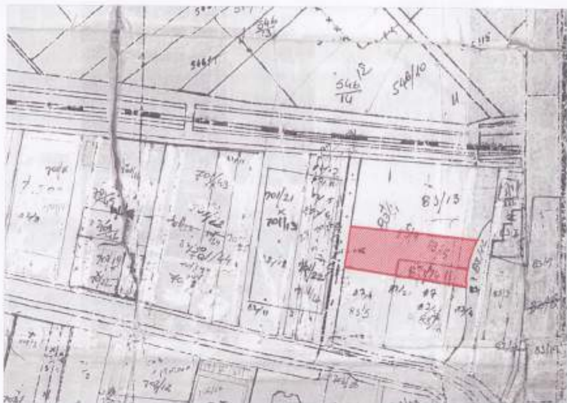
POZICIONI KADASTRAL SH.K. 1:2000