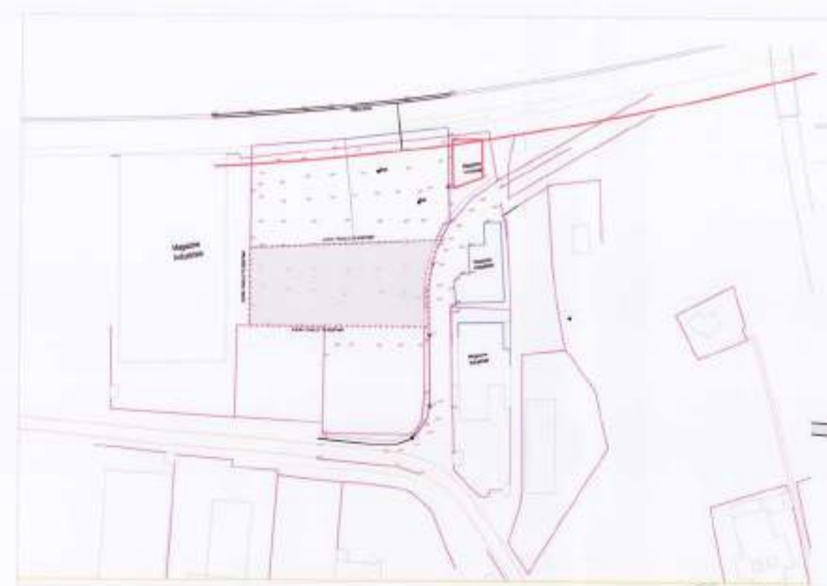
HARTA TOPOGRAFIKE SH.K. 1:2000