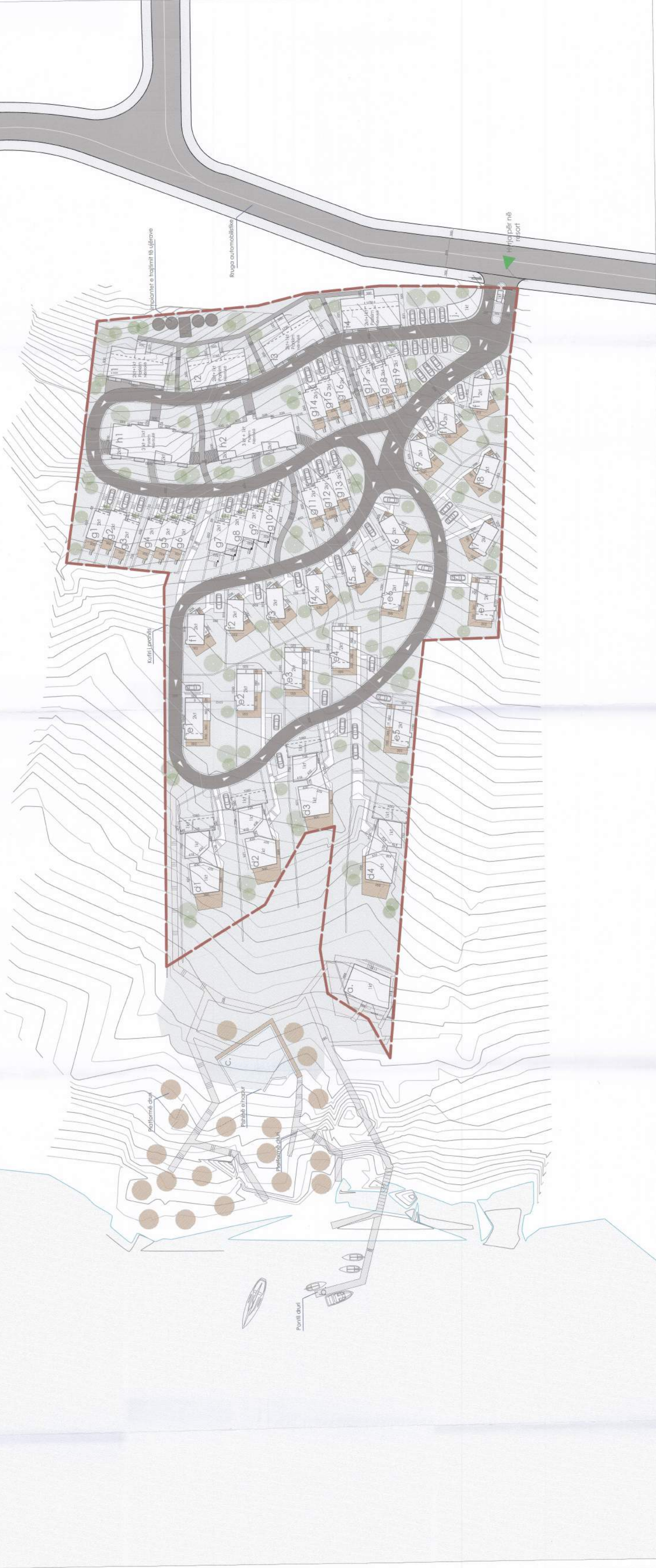
PLANI I VENDOSJES SË STRUKTURËS SHK. 1: 500