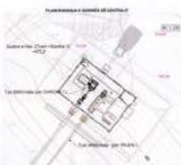
PLANIMETRIT E VENGSJENTEVE SH. 1:200

REPUBLIKA E SHQIPËSË KËNDRI KOMBËTAR I TERRITORT