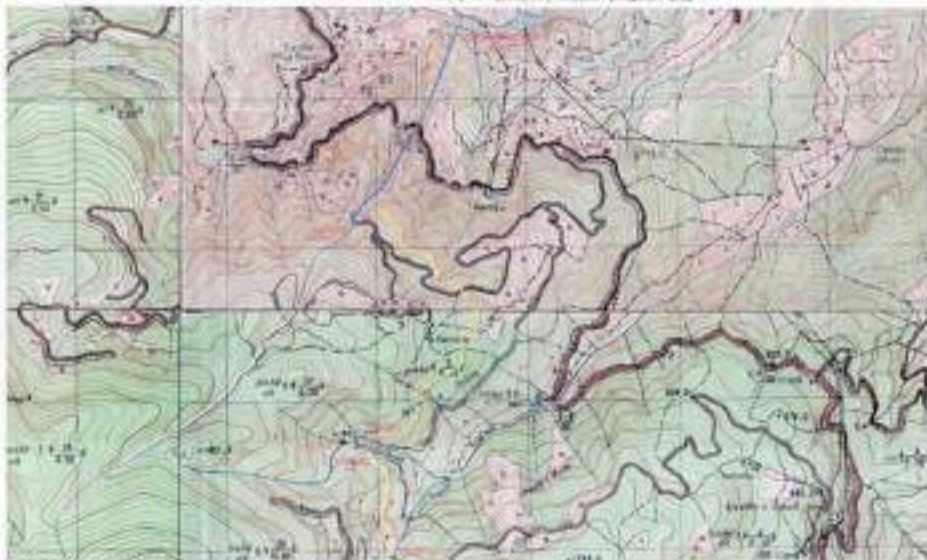
PLANI HORIZONTALE E STRUKTURES E HORIZONTALIT TE TRUJDI SA 1:1000