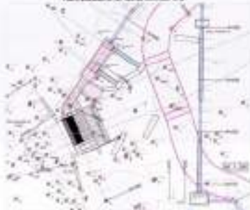
PLANIMETRILLA E VEPRIS SE BARRAZI N° 2