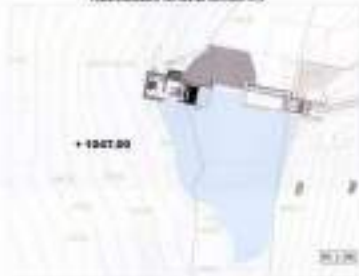
PLANIMETRILLA E VEPRIS SE BARRAZI N° 3