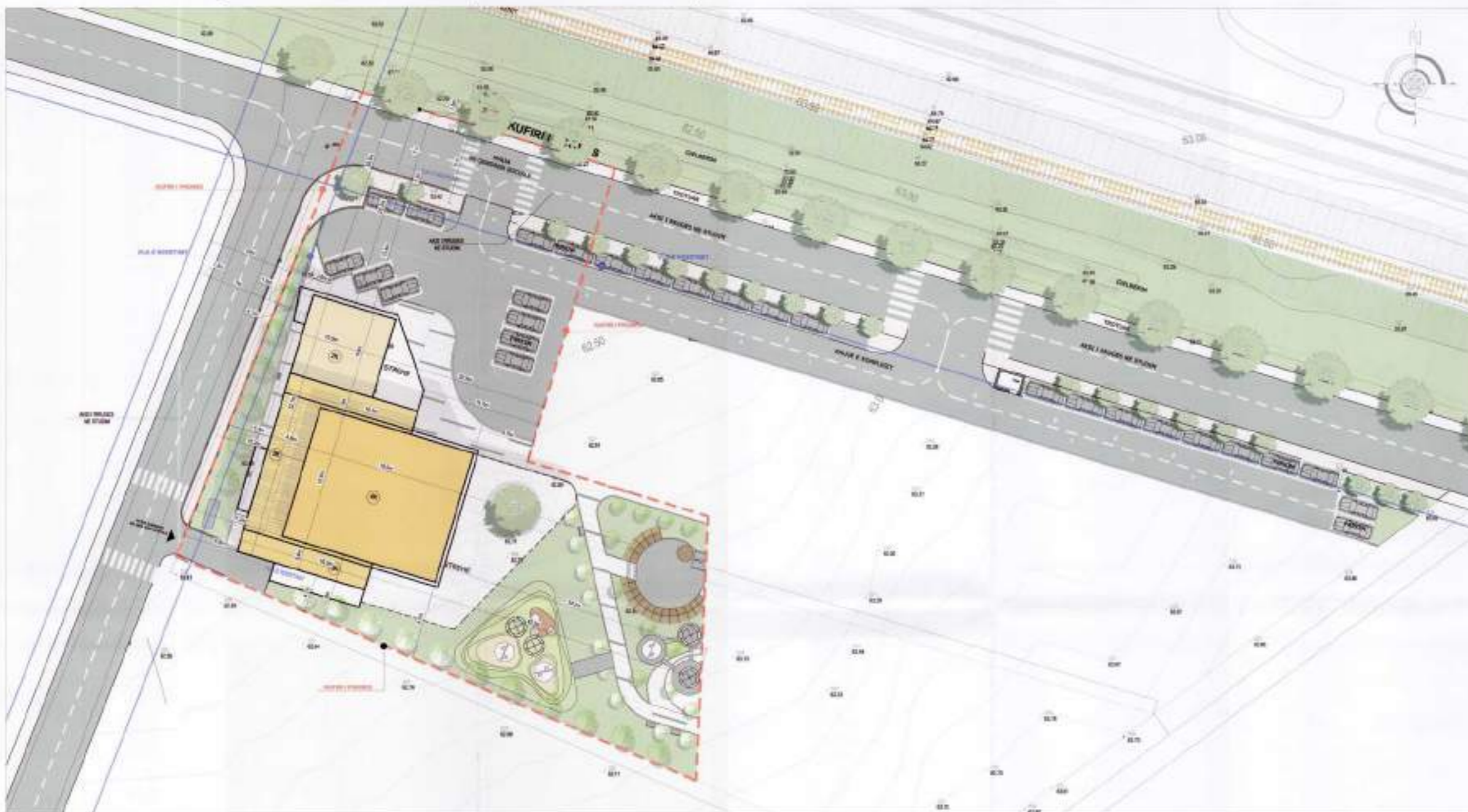
PLANI I VENDOSJES SË STRUKTURËS, SH.K.1:300