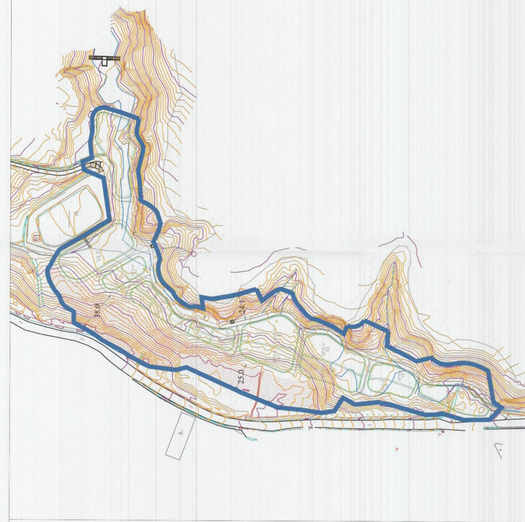
HARTA TOPOGRAFIKE SHK. 1:2000