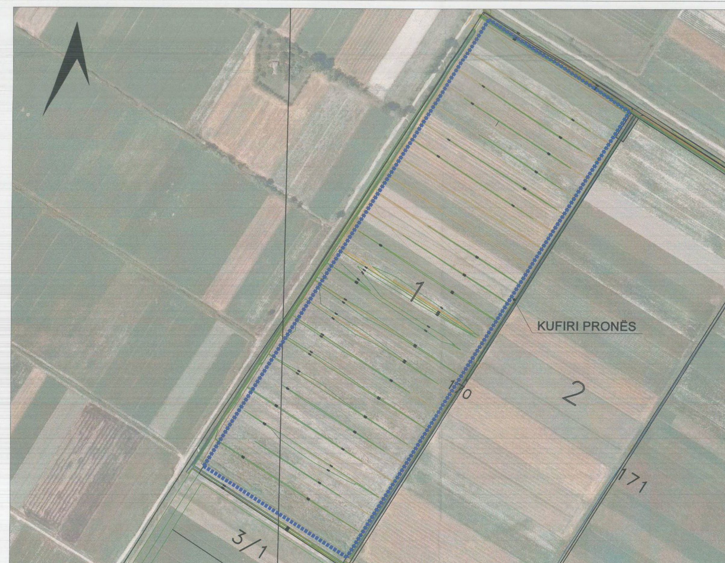
HARTA TOPOGRAFIKE SHK. 1:2500