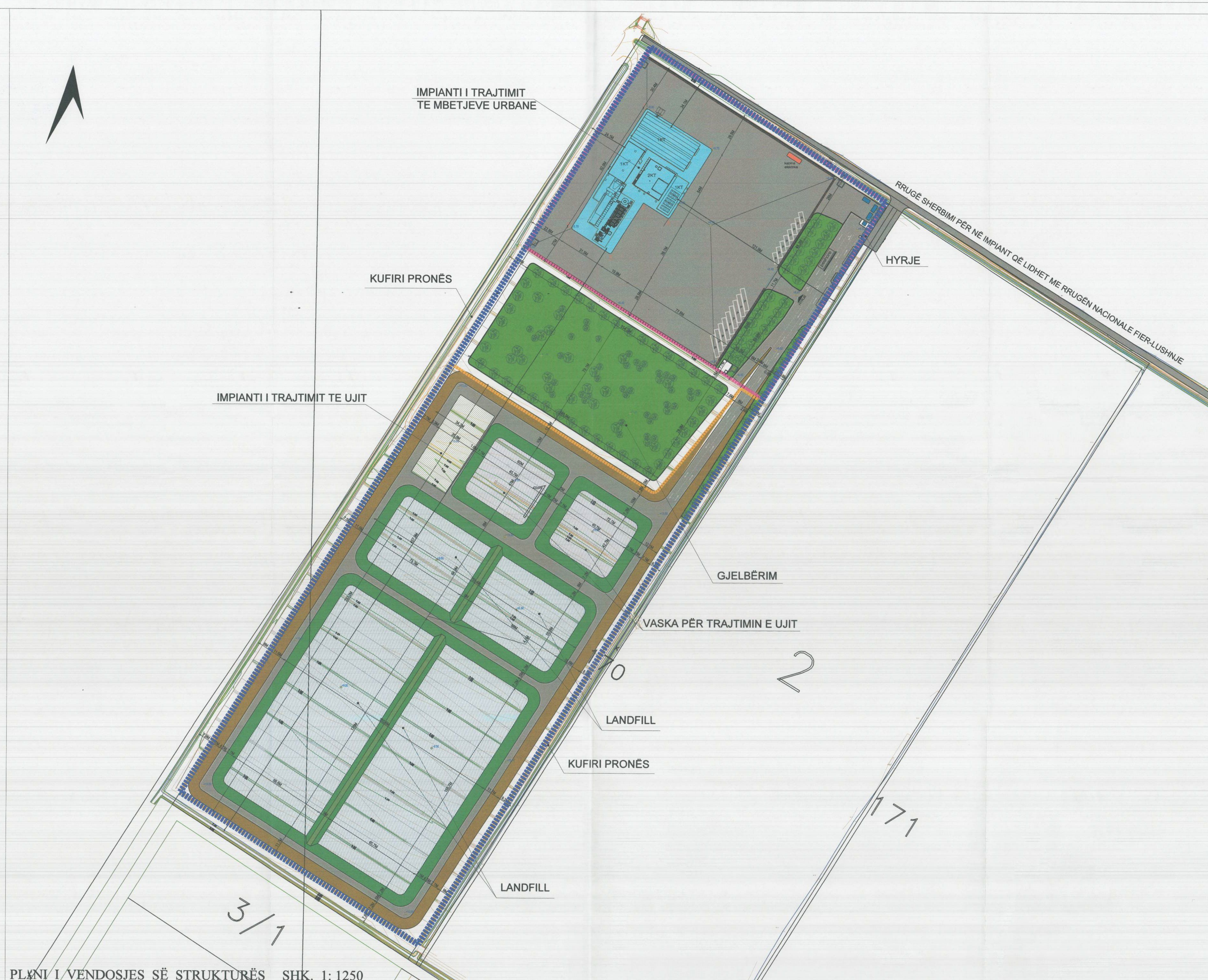
PLANI I VENDOSJES SË STRUKTURËS SHK. 1: 1250